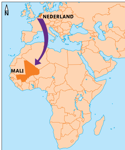
© Arens Grafische Vormgeving / ICCO 2008

Berg neemt samen met Bassitan een kijkje op de velden. Nasière legt aan hem uit: "We moesten ons inschrijven voor een tuintje, want de animo is groot. Hopelijk kunnen volgend jaar nog meer vrouwen meedoen."