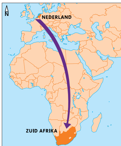
© Arens Grafische Vormgeving / ICCO 2008

NOVA heeft de CO 2 -reductie officieel laten vaststellen en verifiëren door KPMG. Hierbij zijn CO 2 -rechten beschikbaar gekomen voor de verkoop. FairClimate, het klimaatprogramma van ICCO, heeft in juni 2007 24.000 ton credits gekocht van NOVA. Met de opbrengsten kan NOVA meer projecten mogelijk maken. (HN) ■