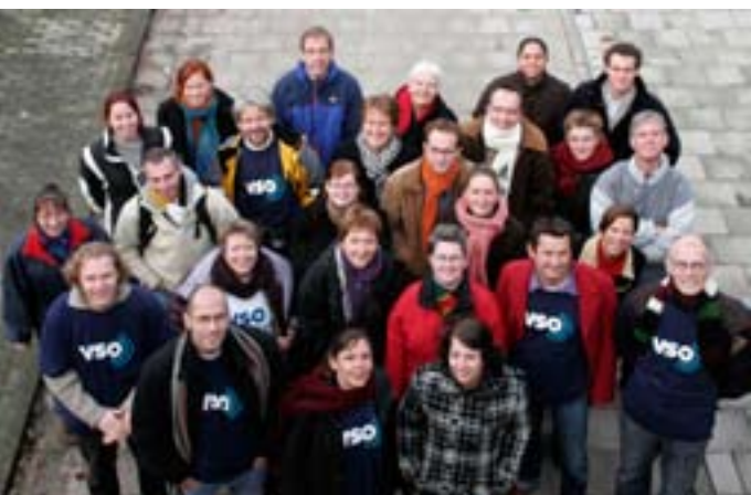
©VSO/ Lilian van Rooij. Ons belangrijkste middel in de strijd tegen armoede: de uitzending van vakdeskundigen zoals deze groep.

Ook de leeftijd verandert. Jongeren vinden na een ontwikkelingsstudie moeilijk een baan in hun vakgebied door gebrek aan praktijkervaring. VSO Nederland biedt deze jongeren de kans om die ervaring op te doen via het Stap programma. Als Stapper ondersteunen zij VSO programmakantoren in Afrika en Azië. Sinds 2004 zijn er 16 jonge deskundigen via Stap aan de slag gegaan. Het programma helpt ook om de sector ontwikkelingssamenwerking te verjongen. De meeste voormalige Stappers vond direct een functie bij een ontwikkelingsorganisatie. Als proef plaatst VSO Nederland nu in samenwerking met VSO Kenia twee jonge Keniaanse deskundigen in Papoea Nieuw Guinea en Mongolië.