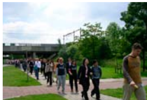
Personeel van het Randstad hoofdkantoor hield een lunchwandeling voor VSO en liep zo € 4.000,- bij elkaar.