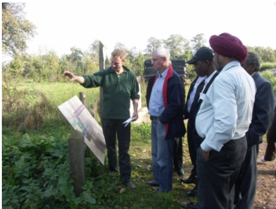
Visita a las instalaciones de una granja orgánica

Los estudiantes participantes leyeron algunas reflexiones piadosas. En el Discurso Espiritual del segundo día se incluyó una oración cristiana pronunciada en árabe (la oración de Sabeel), la cual también pudo ser comprendida por los participantes musulmanes. Durante el Discurso Espiritual del tercer día, nueve participantes de diferentes tradiciones religiosas y un agnóstico compartieron sus reflexiones personales.