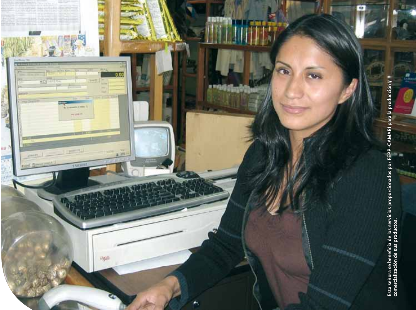
Esta señora se beneficia de los servicios proporcionados por FEPP-CAMARI para la producción y comercialización de sus productos.

En el sector de la salud fue posible percibir una diferencia entre el impacto logrado por los proyectos relativos a la gestión de la salud y el alcanzado por los proyectos relacionados con la sensibilización respecto de los temas de la salud. Estos últimos mostraron una tendencia mayor a lograr un impacto general alto, mientras que los proyectos de gestión de la salud lograron resultados más altos en lo que a empoderamiento se refiere. El impacto en el género logrado en el sector de la salud es extremadamente alto si se lo compara con otros sectores (por ejemplo, educación y oportunidades de sustento).