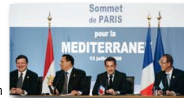
Vlnr Barroso, Mubarak, Sarkozy, Ban Ki-Moon

Binnen Europa vaart Frankrijk een eigen koers. Nicolas Sarkozy, sinds mei 2007 de Franse president, constateert dat het 'Barcelonaproces' is vastgelopen door controverses met Arabische landen rond Israël. Sarkozy komt met een 'Mediterrane Unie' voor alléén de landen die grenzen aan de Middellandse Zee. Hij sluit Turkije en heel veel EU-landen uit van deelname. Het Franse solisme wordt door EU niet gepikt en de Franse president moet accepteren dat alle landen van het Barcelonaproces meedoen. In juli 2008 mag Sarkozy zijn unie in Parijs presenteren, samen met co-voorzitter Mubarak, de president van Egypte.