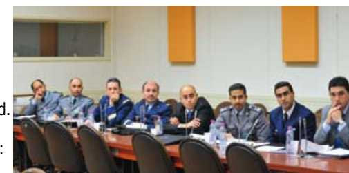
Marokkaanse militairen op bezoek bij de NAVO december 2008

De Marokkaanse regering heeft recent voor bijna € 3 miljard aan grote defensieorders uitgezet: De VS leveren 24 F-16's (€ 1,6 miljard), Frankrijk levert een FREMM Multimission fregat (€ 470 miljoen). Nederland profiteert flink mee: