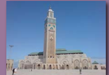
De Hassan II moskee in Casablanca

De strijd tegen de radicale islam is sinds 9/11 en een reeks zelfmoordaanslagen in Casablanca in 2003 een belangrijk thema in de Marokkaanse politiek.