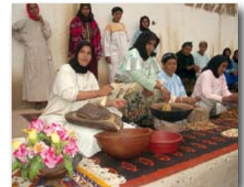
Productie Arganolie door Marokkaanse vrouwen

De zaden van de Argan-boom, die groeit in Zuid-Marokko en het aangrenzende gebied in Algerije, bevatten een kostbare olie die wordt gebruikt voor medicinale doelen en cosmetica. Het winnen van Arganolie is van oudsher en vrouwenzaak, maar deze kostwinning staat onder druk door verdroging en verwaarlozing van de verspreid groeiende bomen. Met hulp van de EU zijn 42 lokale en vijf regionale coöperatieën opgericht en 8 onderzoeksprojecten gestart naar de duurzame winning en toepassing van Arganolie. Verder werden een onderwijsprogramma voor vrouwen en een alfabetiseringsprogramma mogelijk gemaakt voor 2000 vrouwen die werkzaam zijn in de winning van 'het Marokkaanse goud'.