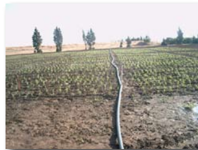
De EU helpt Marokko water te zuiveren voor de landbouw

Marokko profiteerde tussen 2003 en 2008 van het regionale EU-programma MEDA Water (€ 36,5 miljoen). Dankzij dit programma en het LIFE-milieuprogramma van de EU heeft Marokko in een gebied ten zuidwesten van Casablanca – tussen Sidi Bennour en Jadida - vervuild rivierwater gezuiverd voor de lokale landbouw. Een proefstation in Khmis Zmamra haalt de verontreiniging uit het water en maakt kunstmatig uit het opgevangen slib.