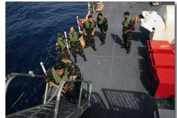
US Coast Guard traint Marokkaanse Koninklijke Marine (2009)