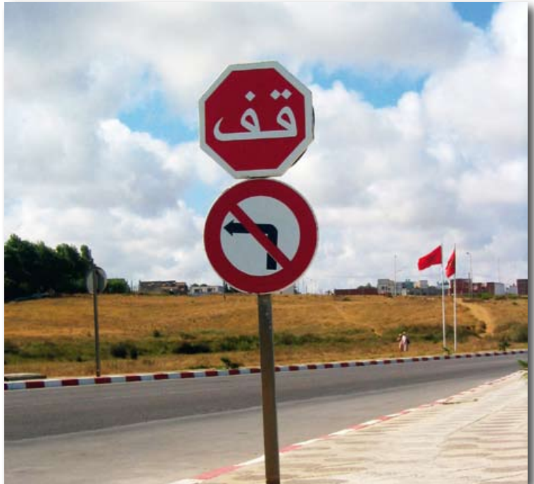
Eén op de vier wegen in Marokko wordt aangelegd met steun van de Europese Unie.

In het 'reisadvies Marokko' adviseert het Nederlandse Ministerie van Buitenlandse Zaken toeristen 'extra waakzaam' te zijn. In 2007 bliezen vijf zelfmoordterroristen zichzelf op bij een politieactie in Casablanca en viel er een dode bij een bomaanslag. Het advies is grote groepen mensen en demonstraties te mijden. Op drugsmokkel en seks met kinderen staan zware straffen. Daar de soevereiniteit van Marokko over de Westelijke Sahara internationaal niet wordt erkend en Nederland ter plaatse geen diplomatieke vertegenwoordiging heeft, kan in dit gebied maar beperkte bijstand worden verleend aan Nederlanders in nood.