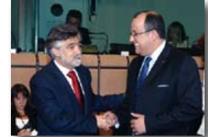
Overleg EU en Marokko in de Associatieraad (2007)

Van 2007 tot en met 2010 besteedt de EU in Marokko € 28 miljoen voor 'goed bestuur' en mensenrechten. Dat is niet meer dan vier procent van het zuivere hulpbudget. Van deze 28 miljoen wordt € 20 miljoen besteed aan ondersteuning van het ministerie van Justitie en € 8 miljoen voor verbetering van de mensenrechtensituatie.