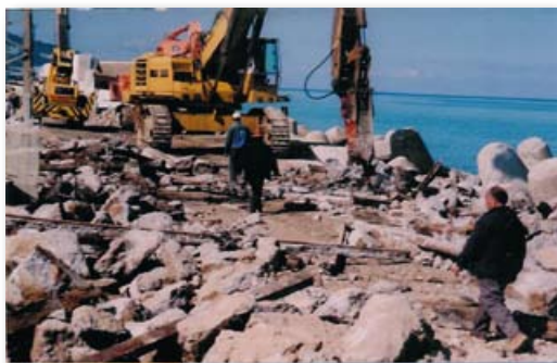
Haven van Tanger

Gezondheidszorg: renovatie en verbetering van 17 ziekenhuizen (€ 70 miljoen), waaronder het Ibn Sina Universitair ziekenhuis in Rabat.