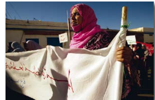
Protest van Werklozen in Sidi Ifni in 2005