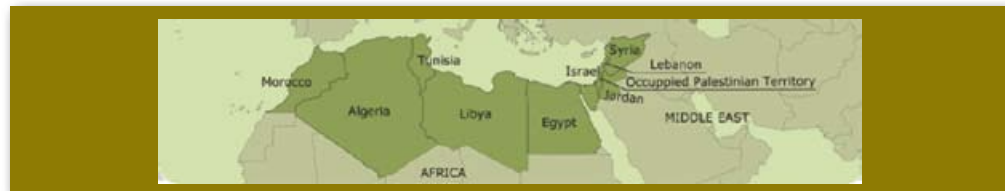
Mediterrane partnerlanden van de EU

De regimes in Noord-Afrika en het Midden-Oosten zijn autoritair, soms in lichtere mate (Marokko), soms in zwaardere mate (Egypte, Tunesië). Onder zulke omstandigheden gaan burgers zich verzetten. De stabiliteit wordt bedreigd. De EU wil absoluut geen radicalisering en onrust aan zijn grenzen, dus ontwikkelde het een 'Euromediterraan' beleid om politieke en economische hervormingen in het gebied te steunen.