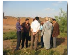
overleg met boeren in Haouz

Dergelijke projecten zijn van groot belang voor Marokko omdat in de praktijk slechts 8% van het Marokkaanse afvalwater gezuiverd wordt. MEDAWARE-onderzoek heeft daarnaast aangetoond dat de helft van Marokko's 72 waterzuiveringsstations kapot is. De EU helpt dus voorkomen dat landbouwgewassen met vervuild water worden besproeid en dat de gezondheid van consumenten en de export naar Europa in gevaar komen.