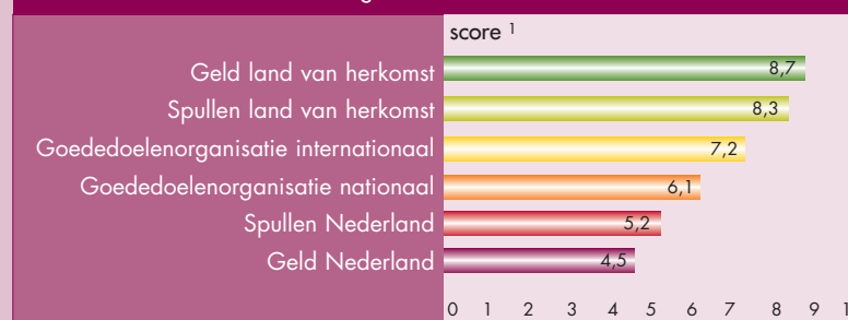
Tabel 1. Favoriete manieren van geven

Aan welk type goede doel doneren migranten in Nederland het liefst? Aan de respondenten is gevraagd goededoelenorganisaties te sorteren naar voorkeur. Op de eerste plaats komen goededoelenorganisaties die zich richten op gezondheid. Deze zijn vooral favoriet bij Ghanezen, Surinamers en Turken. Antillianen en Marokkanen geven de voorkeur aan organisaties die zich richten op maatschappelijke en sociale doelen. Minst favoriet bij alle groepen zijn sport- en cultuurorganisaties. Opvallend is ook de relatief lage plaats van levensbeschouwing (zie tabel 2). Dit komt enerzijds voort uit het gegeven dat levensbeschouwelijke organisaties niet erg populair zijn onder Antillianen en Surinamers, en anderzijds dat islamitische migranten het betalen van zakat 2 als verplichting zien en niet als goed doel.