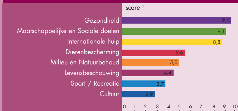
Tabel 2. Type goededoelenorganisaties