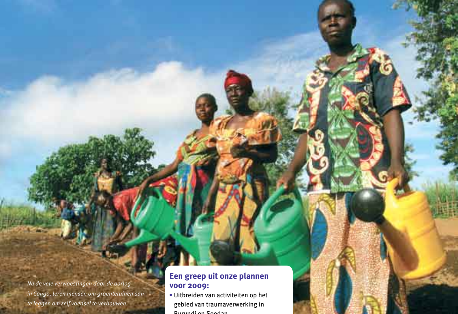
Na de vele verwoestingen door de oorlog in Congo, leren mensen om groentetuinen aan te leggen om zelf voedsel te verbouwen.