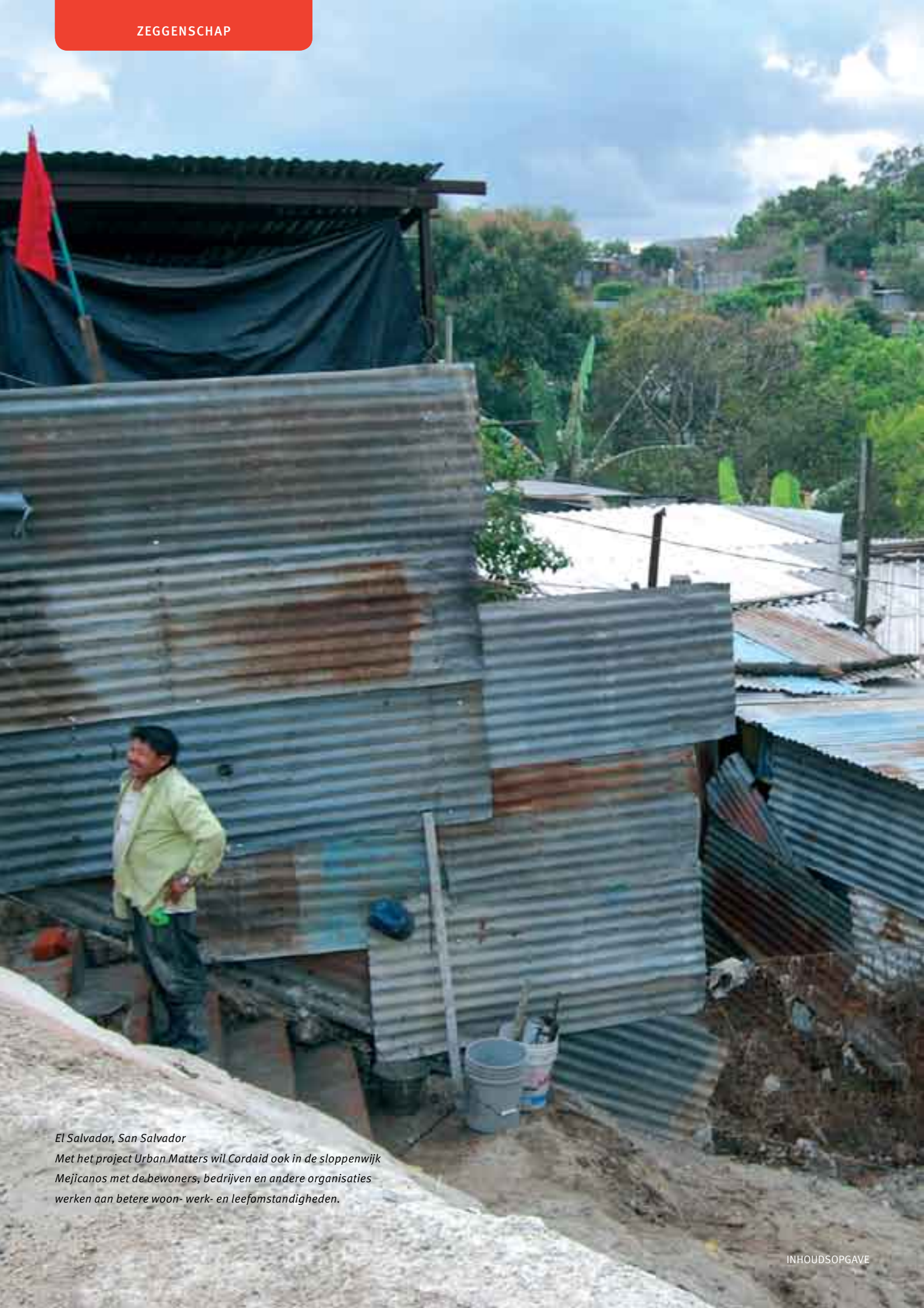
El Salvador, San Salvador Met het project Urban Matters wil Cordaid ook in de sloppenwijk Mejicanos met de bewoners, bedrijven en andere organisaties werken aan betere woon- werk- en leefomstandigheden.