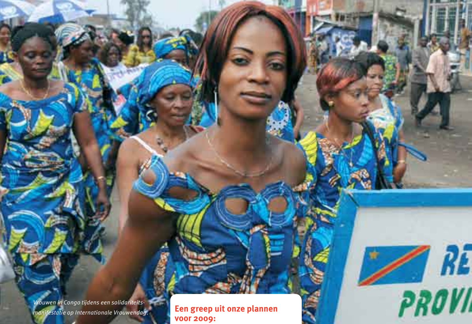
Vrouwen in Congo tijdens een solidariteits-manifestatie op Internationale Vrouwendag.