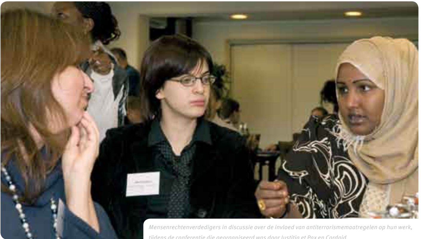
Mensenrechtenverdedigers in discussie over de invloed van antiterrorismemaatregelen op hun werk, tijdens de conferentie die georganiseerd was door Justitia et Pax en Cordaid.