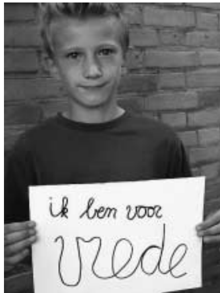
Opening Vredesweek 2003, Tilburg