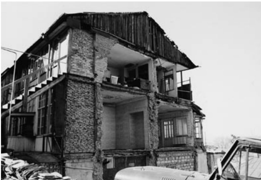
Wederopbouw na een oorlog kost veel geld