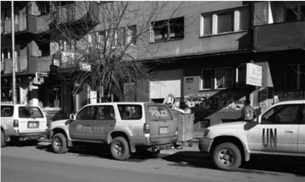
De internationale gemeenschap is nog prominent aanwezig in Kosovo

vernamele organisaties. Het netwerk richt zich op hulp aan vluchtelingen en ontheemden. De aangesloten lidorganisaties zijn zowel in Servië, Montenegro als in Kosovo werkzaam. In Servië werkt het IKV met Fractal , dat ook bij het KIP-netwerk is aangesloten.