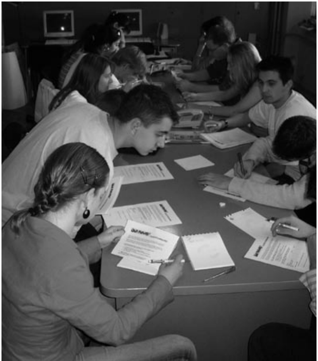
Jongeren zijn meer geneigd tot interetnisch samenwerken

zet, is erg enthousiast, en wordt officieel medeorganisator van de conferentie, samen met het Citizens' Pact en het IKV. De conferentie is een groot succes. Meer dan honderd deelnemers uit heel voormalig Joegoslavië komen naar Fojnica en analyseren enkele best practices , die navolging verdienen. De gesprekken in de kleine groepen zijn zeer geanimeerd en leiden tot een uitvoerig slotdocument. Naar aanleiding van de conferentie worden er op diverse plaatsen nieuwe initiatieven genomen. Dat de internationale gemeenschap niet veel donorgelden meer over heeft voor de terugkeer is een handicap, maar ook zonder veel financiële middelen kunnen – zo blijkt in de praktijk – toch kleine successen geboekt worden.