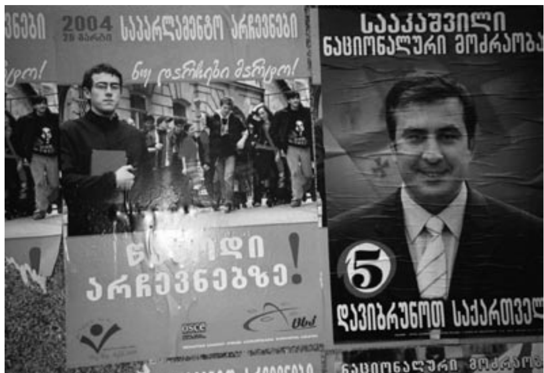
Begin 2004 won Michael Saakashvili in Georgië

Welke kant de ontwikkelingen opgaan en hoe duurzaam verandering zal zijn, zal de komende tijd moeten blijken. Voor de burgers in conflictgebieden betekenen deze bewegingen op dit moment te weinig. IKV – en veel andere vredes- en mensenrechtenorganisaties – hameren op het recht op bescherming dat mensen in conflictgebieden hebben. De vraag die onvoldoende beantwoord wordt is: hoe dwing je als burger je recht op bescherming af?