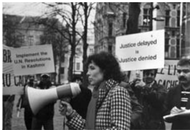
Aandacht vragen voor mensenrechten tijdens de EU-India top