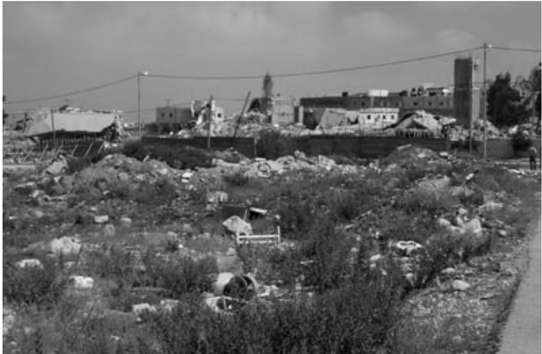
Compound of the late Yasser Arafat in Ramallah

ment reached an all-time high and the right moment was found to bring these out peacefully, yet persistently.