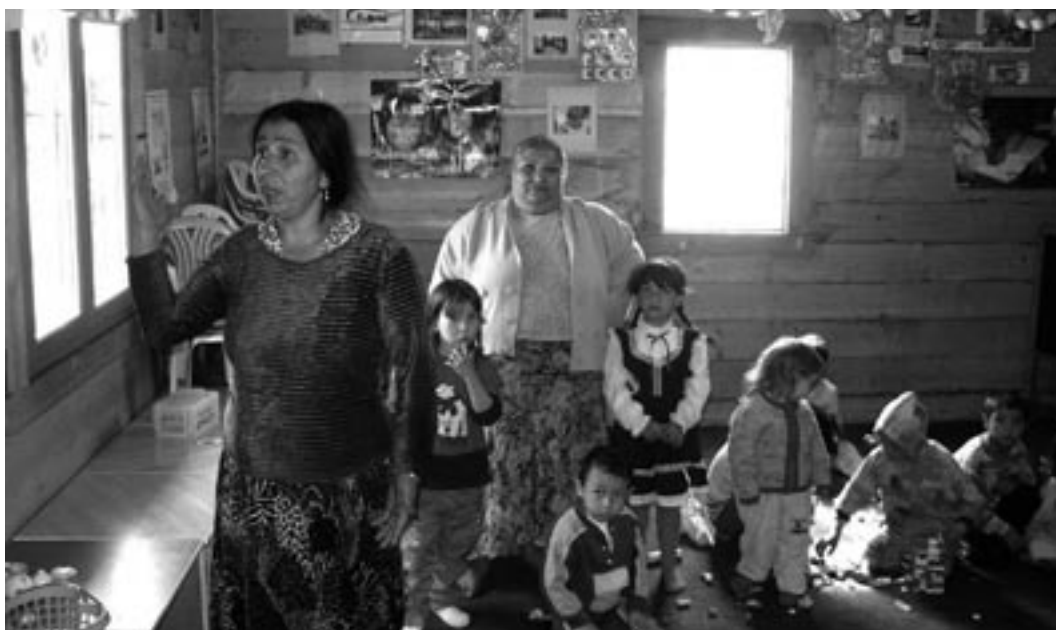
Roma children have a right to education too

In Croatia our partner Proni was able to bring local NGOs and municipal representatives together and work out a practical agenda to address corruption, problems in the judicial system and issues related to the return of refugees. Croatia has reached the 'waiting room' for entry in the European Union and these issues become an issue for public debate. Proni encountered constraints with the running costs of youth centres that were established in fifteen municipalities, but mayors and local activists were able to resolve these problems. Another activity that caught a lot of attention of the local media is the exchange of music bands across ethnical lines.