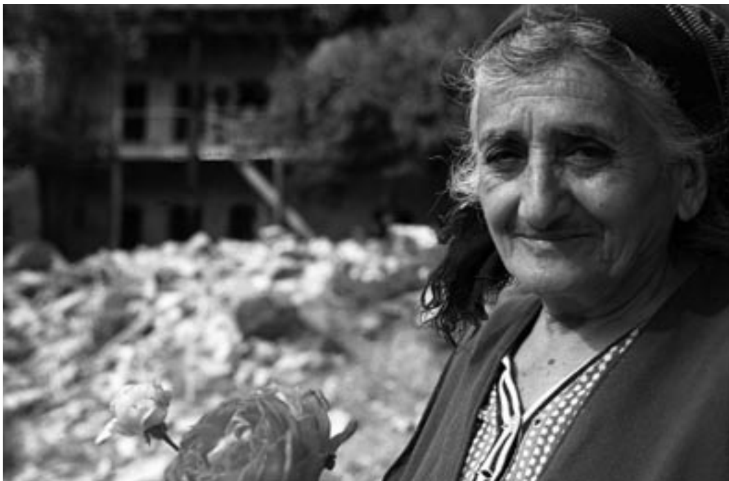
Vrouwen hebben vaak de zorg voor de hele familie als man of vader niet terugkeert van de oorlog

Door middel van het project 'Verhalen over Oorlog', is er meer bekendheid gecreëerd in Nederland over de zuidelijke Kaukasus. De Armeense en Azerbeidzjaanse diaspora in Nederland zijn meer betrokken bij het werk van het IKV in de zuidelijke Kaukasus. Rond de 500 mensen in Nederland zijn in 2004 bereikt.