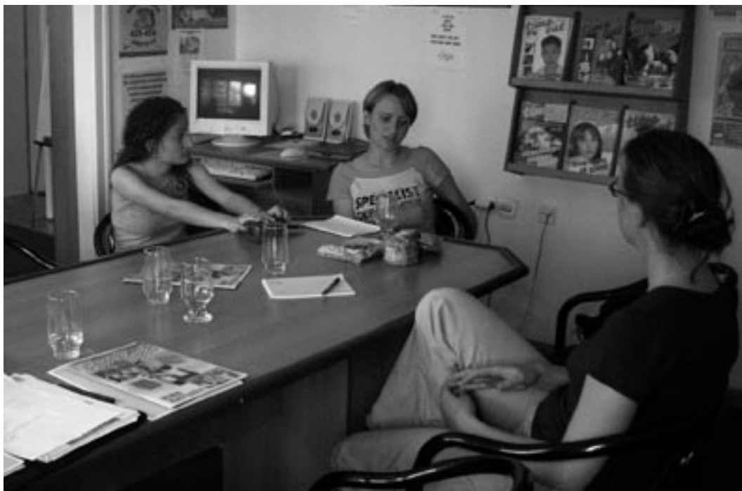
Redactievergadering bij Time Out

De steun van het IKV richt zich op de verbetering van de gespannen verhoudingen tussen de verschillende bevolkingsgroepen en religieuze groeperingen. Door lokale organisaties van burgers te versterken kunnen deze burgers hun politieke elite bevragen en corruptie aan de kaak stellen.