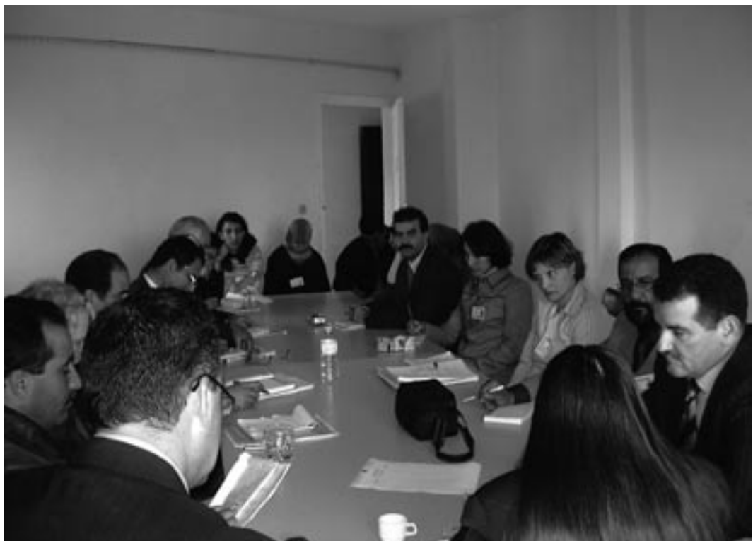
Er is meer ruimte voor het uitwisselen van ideeën in het Midden-Oosten

In samenwerking met de Nederlandse International Dialogues Foundation (IDF), organiseert het IKV een tweetal bijeenkomsten van wetenschappers, journalisten en politici in Arabische landen over de 'rol van de civiele samenleving' en 'persvrijheid en recht op informatie' in januari en april 2004 in Den Haag. IDF bouwt aan een platform met deelnemers uit verschillende Arabische landen. IKV participeert wel in dit platform, maar ambieert geen leidende rol.