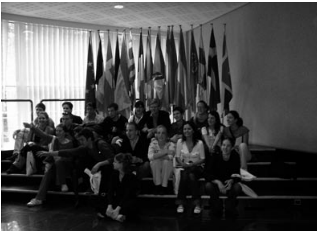
Jongeren uit de Balkan op bezoek bij het Europees Parlement

Positief nieuws is er in 2004 ook. De big bang waarmee in 2004 tien nieuwe lidstaten toetreden tot de Europese Unie mag met recht historisch genoemd worden. Het IKV spant zich al decennia in voor Europese integratie. Europa als vredesproject is een ideaal waar het IKV handen en voeten aan geeft. De belofte van toetreding tot de Europese Unie is een sterke impuls tot verdere democratisering en dialoog voor de landen van voormalig Joegoslavië. Het IKV biedt via programma's als het Citizens Pact for South Eastern Europe (regionale samenwerking van onderop), Our Future (samenwerking tussen Kosovaarse Albanese, Servische en Nederlandse jongeren) en Over the Rainbow (democratiseringsprogramma in Zuid- en West-Kroatië) burgers uit voormalig Joegoslavië kansen om met elkaar in gesprek te gaan over de toekomst van hun samenlevingen. Binnen al deze projecten blijkt telkens dat de weg naar democratie volgens deze burgers via Brussel loopt.