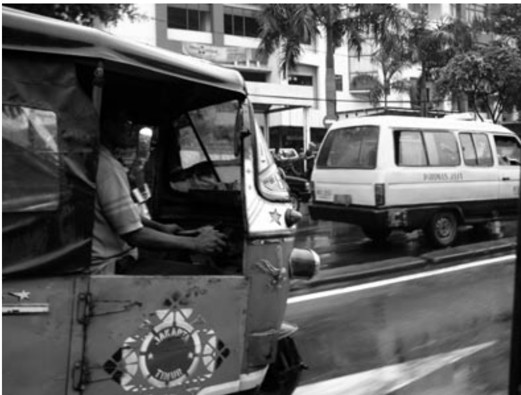
Vrede op de Molukken begint ook in Jakarta