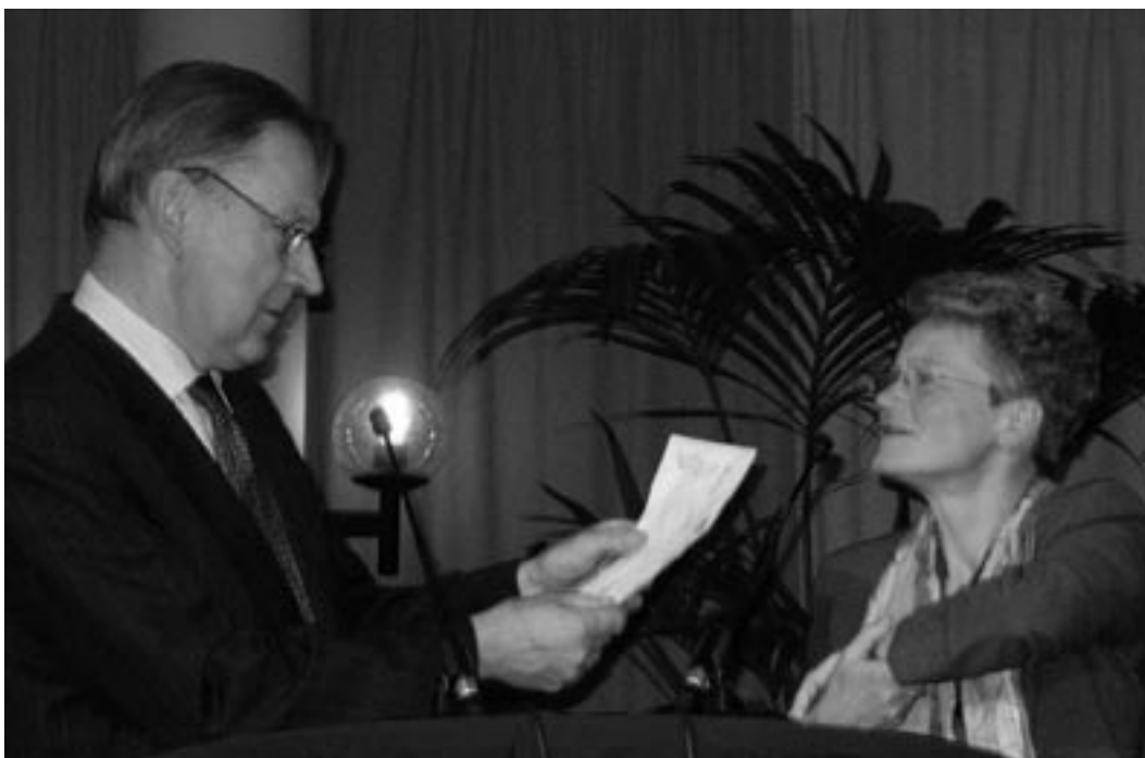
A Dutch member of Parliament receives IKV's plans for peace

In September the annual Peace Week took place organised with Pax Christi . The grand opening of the week was co-organised with the Council of Churches and the Centre for International Cooperation in Zwolle. 'Taking steps against violence, moving towards peace' is this year's motto, highlighting the fact that peace needs to be propelled by local activists. As the Peace Week coincides with the presentation of the National Budget by the Finance Minister, IKV presented its peace plans and suggestions, collected from partner organisations from all over the world, to the Standing Committee for Foreign Affairs of the Dutch Parliament. At the same time a series of practical action perspectives for local church groups were formulated. We used the Peace Week also as an opportunity to highlight the work of our partners in the Dutch media. There were guests from Bosnia-Herzegovina, Iraq, Palestine and Kashmir.