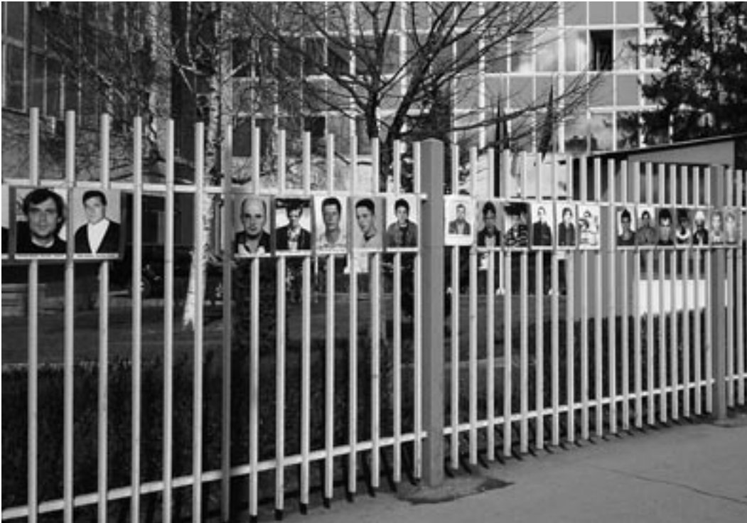
Foto's van vermiste personen

In 2004 hebben in Srebrenica gemeenteraadsverkiezingen plaatsgevonden. Dat brengt zoveel politiek geharrewar en onzekerheid over functies met zich mee, dat we besloten hebben om de reizen van gemeentelijke delegaties even uit te stellen. Bij gelegenheid van een bezoek aan Srebrenica in november – het stof van de verkiezingen is al voor een deel neergedaald, al met al niet veel veranderd – zetten we de prioriteiten voor 2005 op een rij: focus op gemeentelijk jongerenbeleid, opnieuw aandacht voor vormen van burgerparticipatie. De Jongerenraad van Srebrenica heeft een plan ontwikkeld voor een jongeren centrum, en de gemeente wil dat graag ondersteunen.