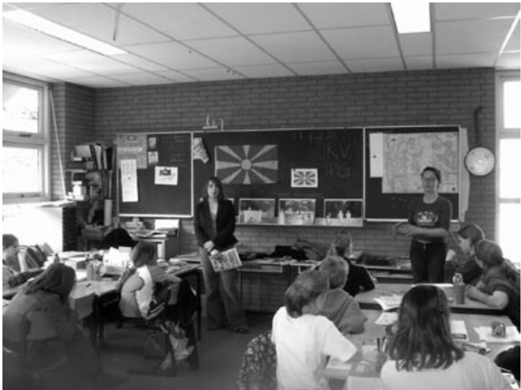
A guest lecture on Macedonia

In 2004 IKV spent € 3.121.990 on programme activities. Compared to 2003 this is an increase of 13%. Our financial reserves are healthy and our accounts were cleared by the auditor. One of the important improvements in our administrative machinery was the introduction of a system of time management for all staff.