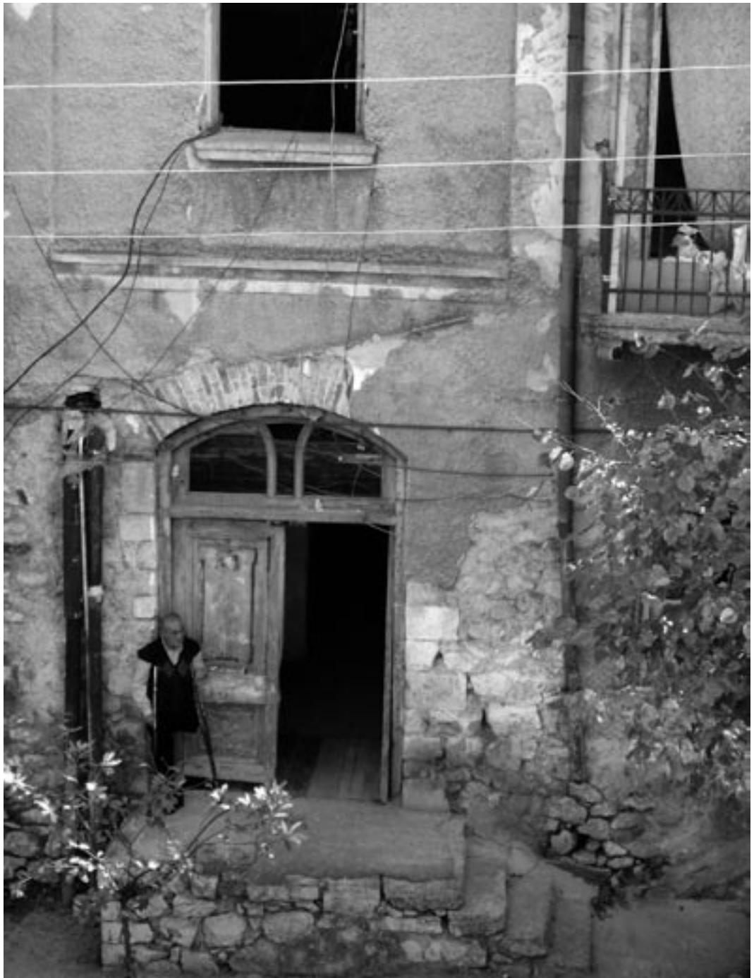
Oorlogsinvalide man voor zijn huis

Steeds meer burgers worden betrokken bij samenwerking over de eigen grenzen heen. Dit geeft hoop voor de toekomst; hoe meer mensen daadwerkelijk contact hebben met mensen van andere nationaliteiten, hoe schraler de voedingsbodem zal zijn voor nationalistische en oorlogszuchtige retoriek.