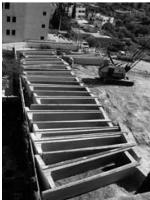
Bouw van de muur bij Abudis

Op 9 juli doet het Internationaal Gerechtshof een adviserende uitspraak over de muur die Israël, als veiligheidsmaatregel tegen aanslagen vanuit de Westelijke Jordaanoever, bouwt op bezet gebied. Het Gerechtshof is van mening dat de muur moet worden afgebroken en dat de Palestijnen die schade hebben geleden, moeten worden gecompenseerd. De Algemene Vergadering van de VN neemt dit advies over. Het Hooggeerechtshof in Israël bepaalde eerder dat de muur op een aantal plaatsen een zodanige humanitaire bedreiging voor de Palestijnen vormt dat de route van de muur daar moet worden verlegd.