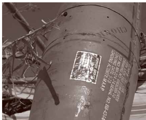
Dood en verderf zaaiende clustermunitie