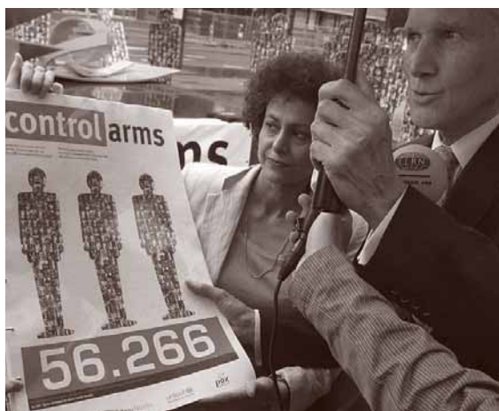
Minister Bot ontvangt petitie