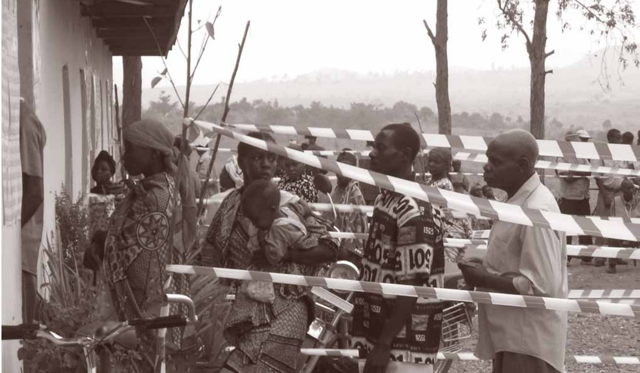
Verkiezingen in DR Congo

onafhankelijk radiostation in Soedan een belangrijke pioniersfunctie vervuld, die nu overgenomen is door twee grote stations (gefinancierd door USAID en VN). De opgebouwde expertise wordt gebruikt bij het opzetten van een centrum voor vrede en democratie in het zuiden van Soedan. Verder is in 2006 begonnen met het opzetten van een actienetwerk voor kleine wapens: SSANSA. En tenslotte is het Sudan Platform Nederland inmiddels een geaccepteerd overlegorgaan tussen verschillende NGO's en het ministerie van Buitenlandse zaken.