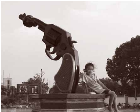
Menselijke veiligheid voorop