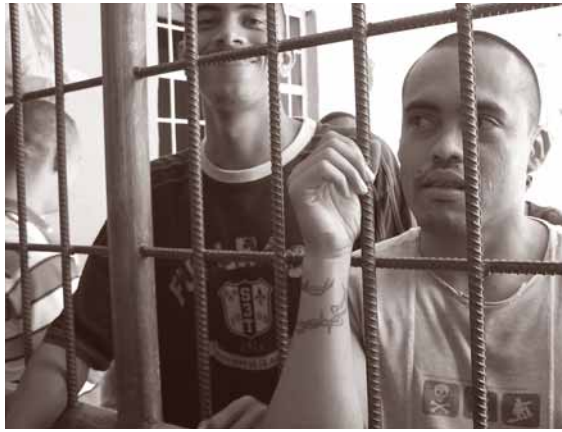
Steun aan gevangenen

De inheemse partnerorganisatie ACIN werkt aan een eigen opvangprogramma voor voormalige indiaanse strijders. De conclusies van het Pax Christi-onderzoek naar reïntegratie neemt ze hierin mee.