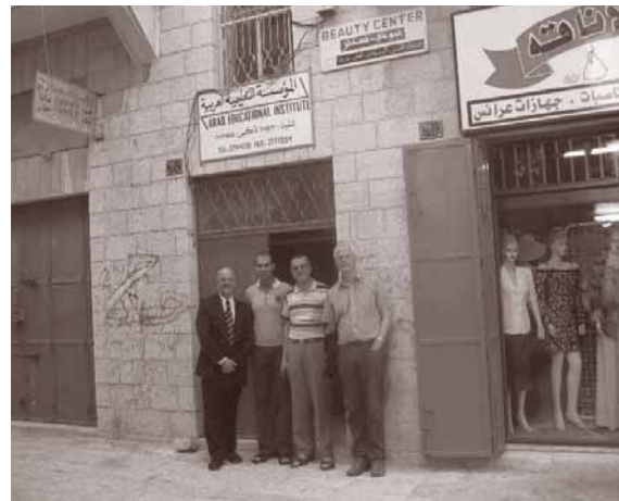
Hoofdkwartier Palestijnse partner

Pax Christi blijft kleinschalige vredesprojecten in 'vergeten' gebieden steunen en aandacht vragen voor de oorzaken van het conflict. Bovendien zal ze ook fundamentele vragen over de toekomst van het gebied op de agenda zetten.