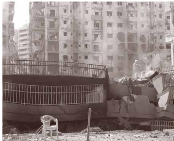
Vernietiging in Beiroet

Libanon: LACR, AJEM, ALEF en Aidoun. Nederland: Cordaid i.v.m. noodhulpprogramma