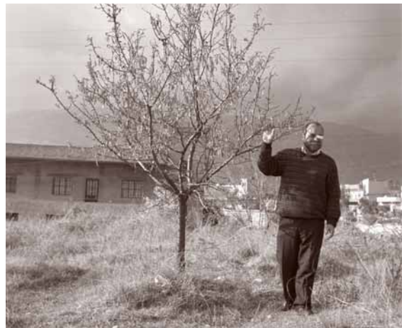
Libanon weer terug bij af

Libanon is nog het opklimmen uit de verwoestende burgeroorlog die tussen 1975 en 1990 het land verscheurde. Maar in 2006 wordt het opnieuw getroffen door een rampzalige oorlog. Die ontvlamt nadat Hezbollah-strijders twee Israëliëse soldaten gevangen hebben genomen. Israël reageert met een militaire aanval vanuit de lucht, over land en vanuit zee op Libanon. Tijdens de 34-dagen durende strijd worden zo'n duizend Libanese burgers gedood, een miljoen mensen ont-