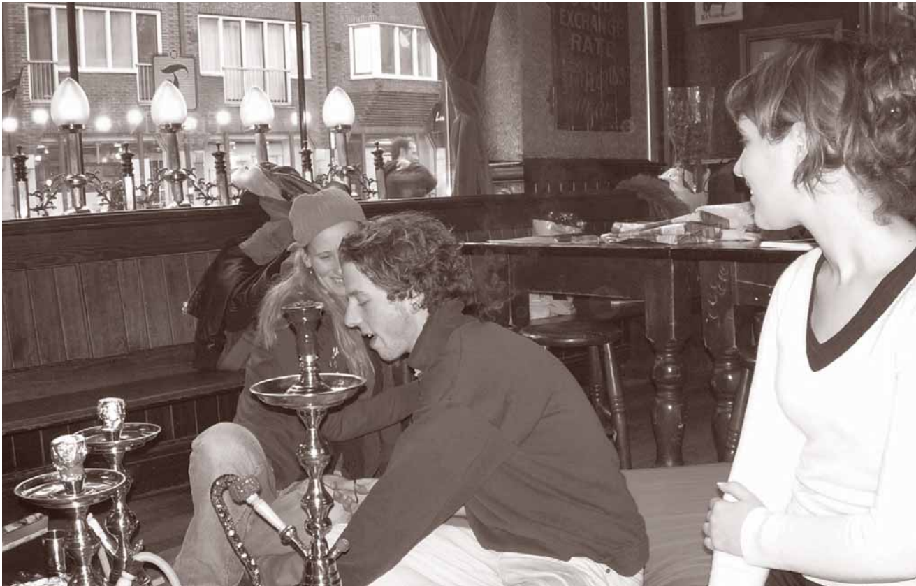
Geslaagde Libanon-middag van Pax Christi