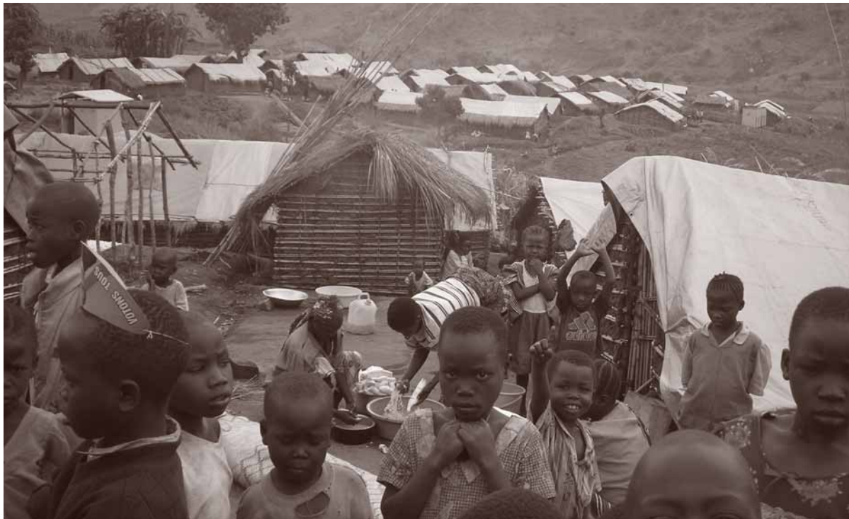
Aantal vluchtelingen in Afrika blijft groeien