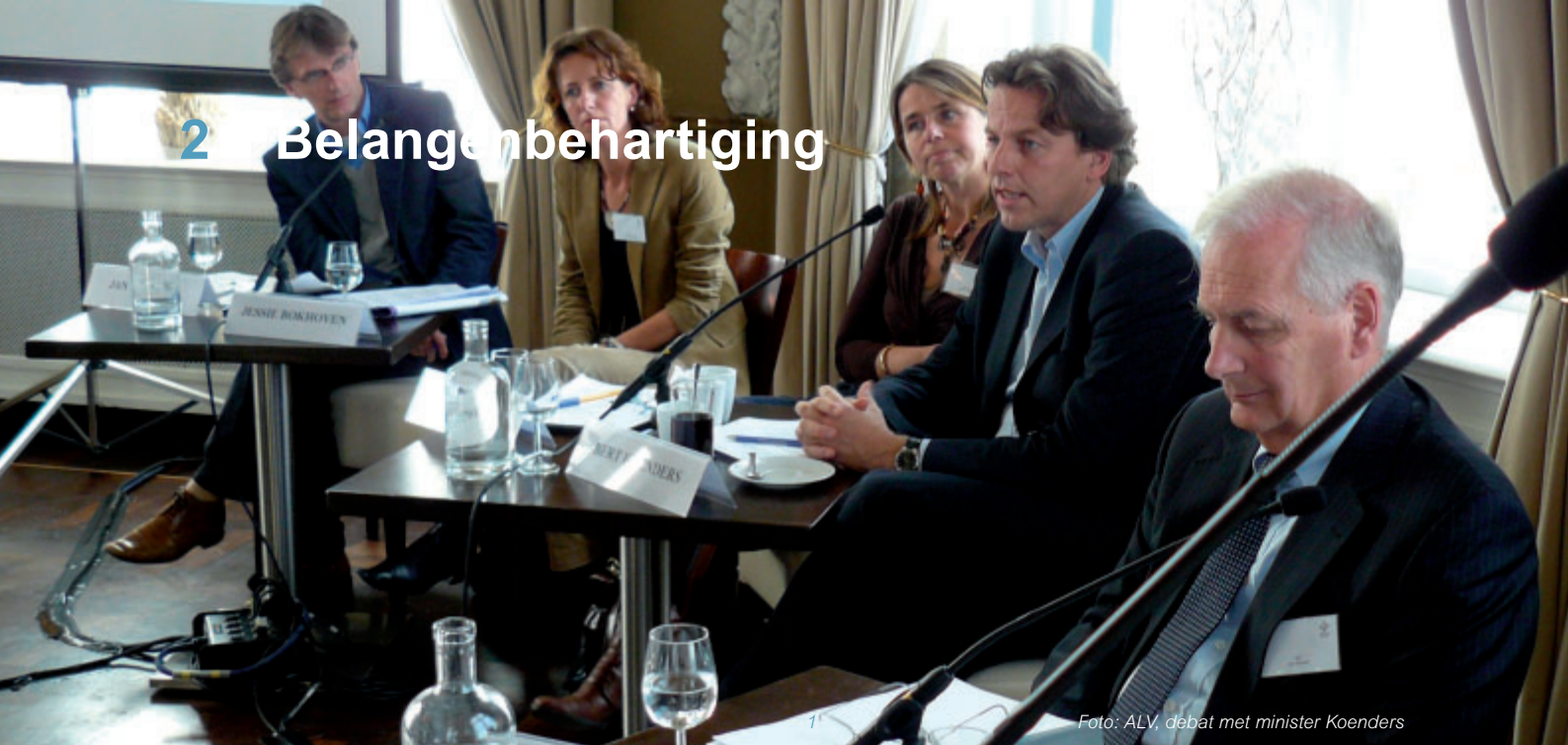
debat met minister Koenders