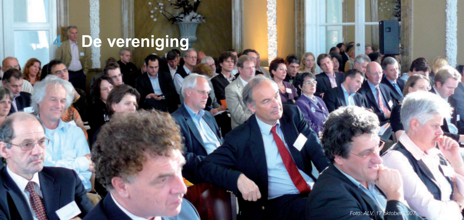
17 oktober 2007