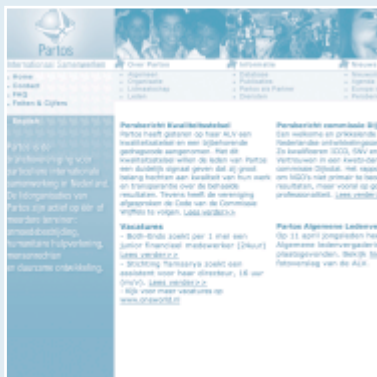
De homepage van Partos: www.partos.nl

Gemiddeld eens per twee maanden ontvingen de leden van Partos een elektronische nieuwsbrief. In 2005 zijn ook nieuwsspecials verschenen over Azië (in verband met de tsunami) en over Kwaliteit (in verband met het kwaliteitsstelsel van Partos). Er is twee keer een nieuwsbrief verschenen voor extern geïnteresseerden met daarin in vogelvlucht de belangrijkste ontwikkelingen in de branche.