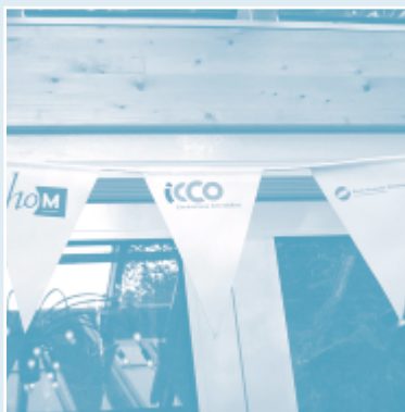
Vlaggenlijn van de leden van Partos