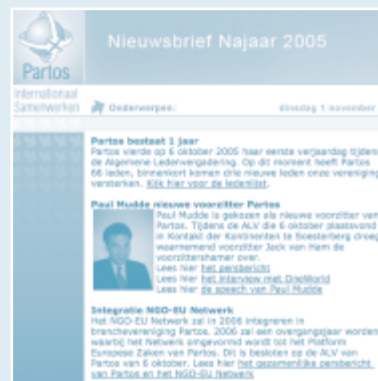
Elektronische nieuwsbrief van Partos, najaar 2005

De website www.partos.nl werd in de laatste drie maanden van 2004 (vanaf de oprichting) gemiddeld 109 keer per dag bezocht. Gemiddeld over 2005 steeg dit aantal naar 139 per dag. Eind 2005 hebben ruim 270 medewerkers van de lidorganisaties aangegeven de elektronische nieuwsbrief van Partos te willen ontvangen. Deze nieuwsbrief kwam in 2005 tien keer uit, waaronder drie Azië-specials (in verband met de tsunami) en één Kwaliteitsspecial. Ruim 200 extern geïnteresseerden hebben in 2005 aangegeven de elektronische nieuwsbrief te willen ontvangen. De nieuwsbrief voor extern geïnteresseerden kwam in 2005 twee maal uit.