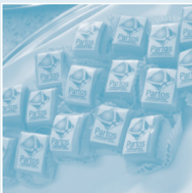
Feestelijke traktatie op de eerste verjaardag van Partos, 6 oktober 2005

Partos is een vereniging waarbij de leden de besluitvorming bepalen door middel van de ALV. In 2005 zijn twee ledenvergaderingen georganiseerd, één in het voorjaar (8 maart 2005) en één op de eerste verjaardag van Partos: 6 oktober 2005. De voorjaars-ALV, gehouden bij ICCO in Utrecht was gekoppeld aan het kwaliteitsdebat. Tijdens het statutaire gedeelte werden de beleidsstukken voor 2005 behandeld als ook het advies van de werkgroep Contributiesystematiek. Tijdens deze vergadering werd tevens een behoeftepeiling gehouden op basis waarvan beleidsprioriteiten werden vastgesteld en de dienstverlening van Partos werd vormgegeven. Deze peiling werd gehouden door middel van een enquête en een 'sinaasappelpeiling'. Alle aanwezigen kregen daarvoor bij binnenkomst twee sinaasappels die ze in glazen pilaren konden laten vallen om aan te geven welke functies van Partos de meeste prioriteit zouden moeten krijgen. De functies 'belangenbehartiging' en 'diensten en producten' kregen de meeste stemmen.