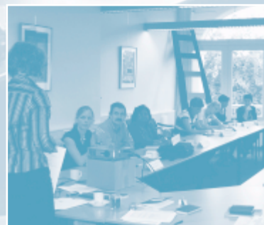
Lobbytraining voor Partos-leden op 8 en 22 september 2005