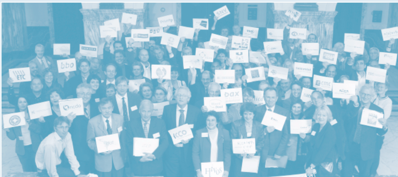
Oprichting Partos, 6 oktober 2004