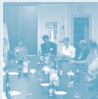
Kennismakingsbijeenkomst voor potentiële leden, 3 november 2005

In 2006 zal Partos extra aandacht besteden aan ledenwerving.