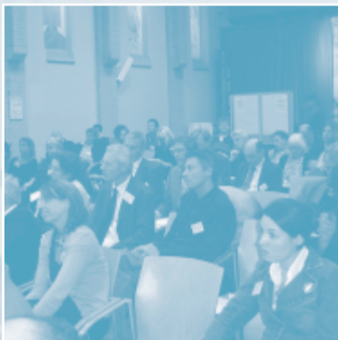
ALV, 6 oktober 2005

Zoals u in de eerdere hoofdstukken kon lezen heeft Partos een vol programma aan activiteiten uitgevoerd waarbij we een belangrijke stap hebben gezet om onze twee hoofddoelstellingen te bereiken: kwaliteitsversterking en de opbouw van een krachtige branche en brancheorganisatie. Natuurlijk zijn dit langetermijn doelen waar we ook in de komende jaren verder aan zullen werken. In 2006 komt de nadruk te liggen op enerzijds de dienstverlening en anderzijds de voorbereiding op de rol van Partos als belangenbehartiger. Daarmee borduren we voort op adviezen van de werkgroepen en de opgestelde documenten over kwaliteitsversterking en communicatie uit 2005.