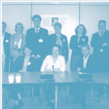
Groepsgesprek met Harry van Bommel, OS-woordvoerder SP-fractie Tweede Kamer

het bestuur van Partos kennisgemaakt en afspraken gemaakt hoe de samenwerking in de toekomst verder uitgebouwd kan worden. Een andere belangrijke stakeholder in dit verband is het Centraal Bureau Fondswerving (CBF). Bijna de helft van onze leden hebben het keurmerk, een verklaring van geen bezwaar of werken hier aan. Met het CBF zijn gesprekken gevoerd over het kwaliteitsstreven bij Partosleden en de plannen die Partos heeft om dit streven te ondersteunen. Tot slot hebben we de oproep van minister Van Ardenne in haar openingswoord bij de oprichting van Partos opgevolgd en aansluiting gezocht bij de SER. Na een tweetal gesprekken heeft de SER Partos uitgenodigd om deel te nemen in ad hoc commissies, voor zover die een relevant onderwerp bestrijken, en elkaar te informeren over activiteiten op het gebied van internationale handel.