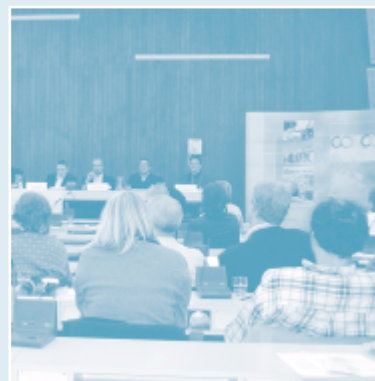
Ledenvergadering van CONCORD, 12 en 13 mei 2005

In 2005 heeft Partos contact gezocht met buitenlandse zusterorganisaties en samen met het NGO-EU Netwerk heeft Partos een Ledenvergadering van CONCORD bijgewoond. Partos heeft vervolgens met Dóchas uit Ierland ervaringen uitgewisseld over mogelijkheden voor kwaliteitsversterking. Tevens heeft Partos een bezoek gebracht aan BOND, de zusterorganisatie in Groot-Brittanië. Hierbij lag de nadruk op kennisuitwisseling over belangenbehartiging. Het bezoek aan BOND werd gecombineerd met een conferentie in Leeds: 'Making Poverty History' in het kader van het Europese voorzitterschap van Groot-Brittanië.