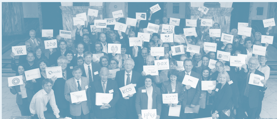
Foto: Oprichting Partos 2004