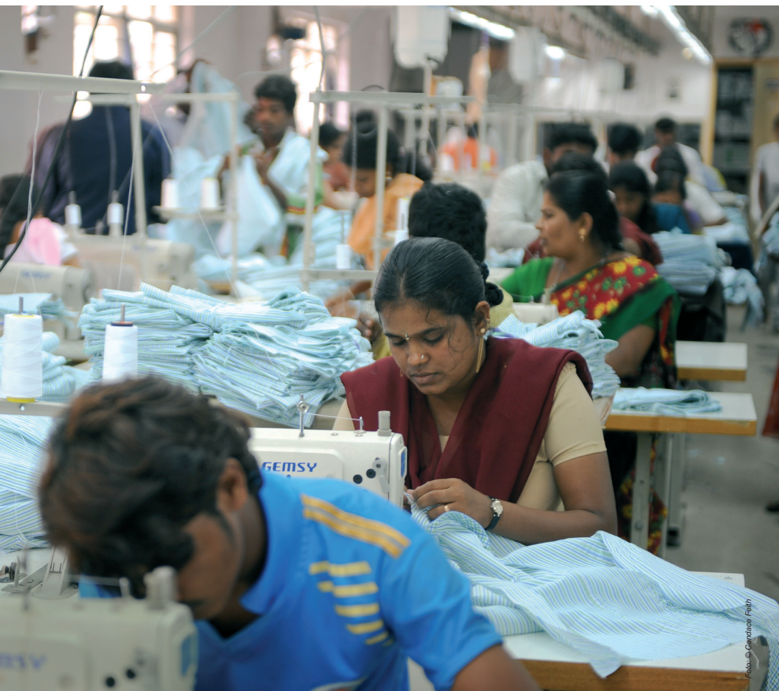
Werknemers in een naaiatelier in Bangalore, India.