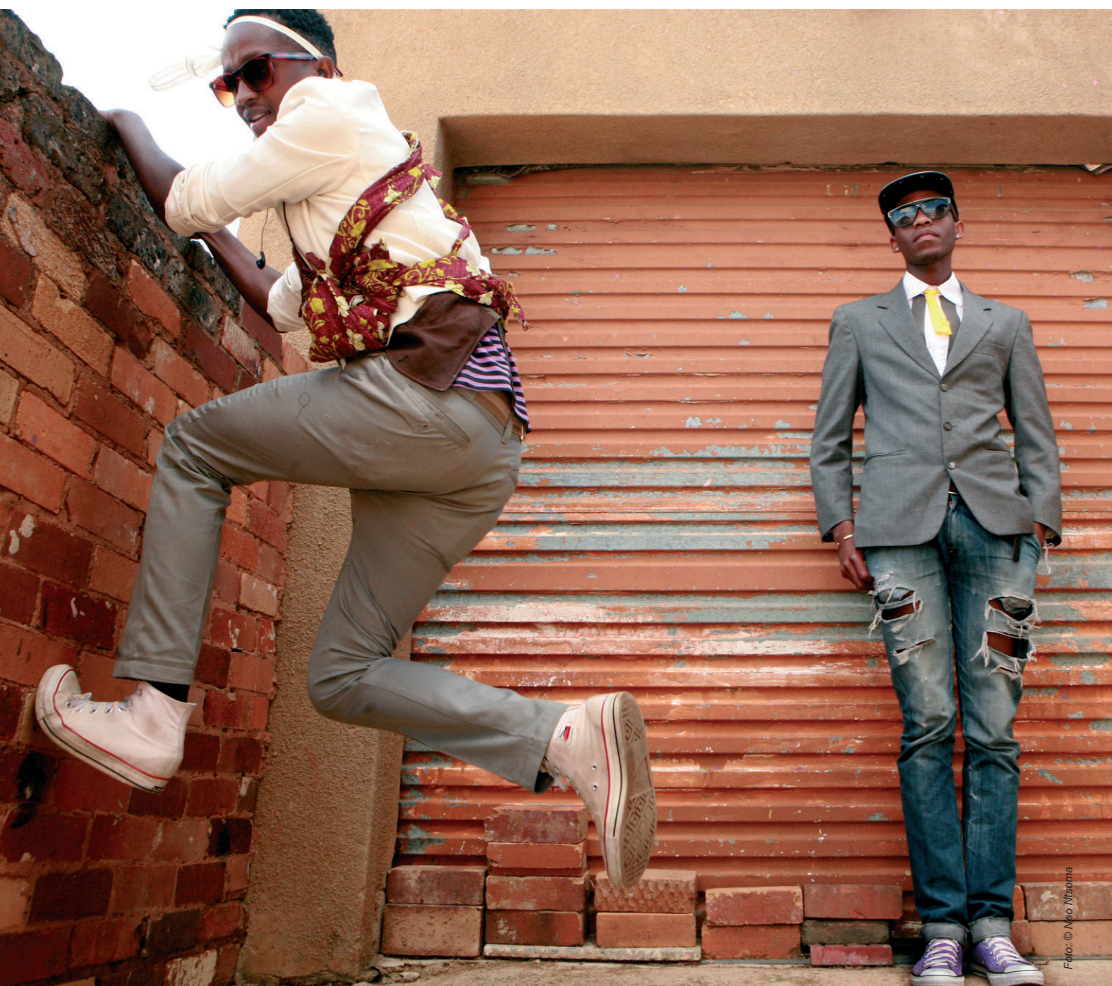
Modeontwerpers showen hun kleding in Soweto, Zuid Afrika.