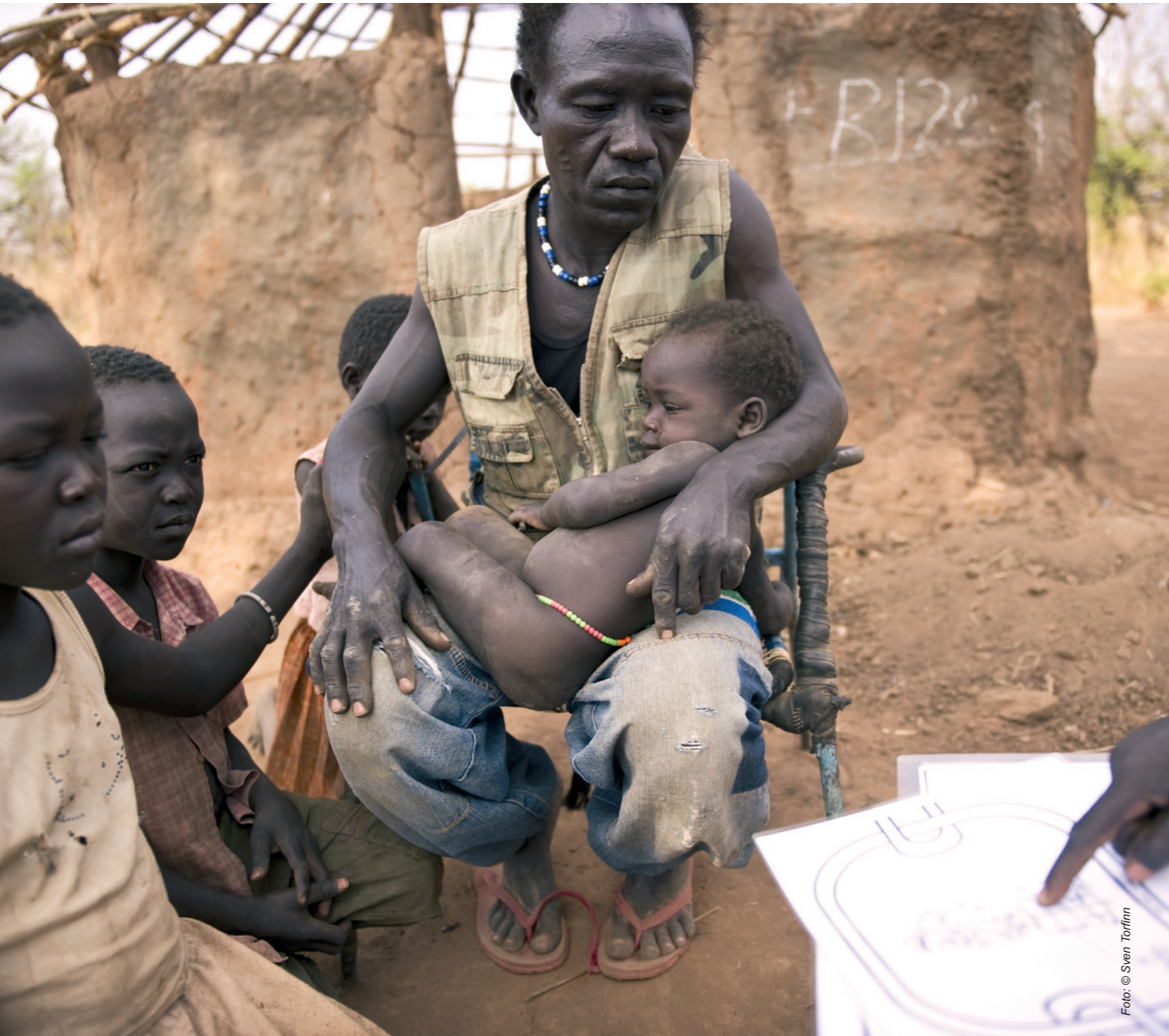
Een familie in Mundri, Zuid Sudan, krijgt voorlichting over hygiëne van een medewerker van MRDA.

Oxfam Novib stelt in haar werk vijf rechten centraal (zie hoofdstuk 1), die vertaald zijn in vijf programma's. Op basis van onze analyse van de ontwikkelingen in de wereld (zie hoofdstuk 2) hebben we in de vijf programma's zes thema's gekozen die de komende jaren prioriteit krijgen. Deze thema's zijn: (1) strijd om land, water en voedsel; (2) eerlijke markten en financiële systemen; (3) toegang tot kwalitatief goed onderwijs; (4) conflictransformatie; (5) toegang tot informatie; (6) zeggenschap van vrouwen over hun lichaam. Welke prioriteiten in een land of regio nadruk krijgen en in welke mate, hangt af van de lokale situatie en de gezamenlijke Oxfam-strategie.