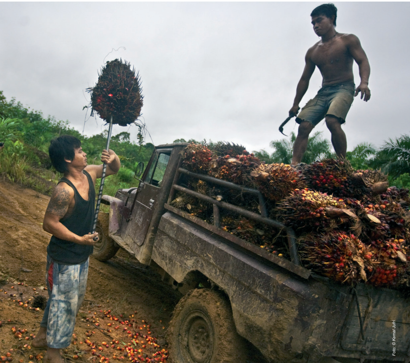
Werknemers van een Palmolieplantage in Indonesië.

Hoe werken we? Welke waarden vindt Oxfam Novib belangrijk in de wijze waarop we werken? Allereerst is dat samenwerken op basis van respect en gelijkwaardigheid. We werken met anderen aan een rechtvaardige wereld zonder armoede en we stimuleren samenwerking tussen anderen (zie hoofdstuk 1). Andere belangrijke waarden zijn doelmatigheid en contextspecifiek werken. Ook vinden we focus en flexibiliteit belangrijk: terwijl we strakke keuzes maken voor gebieden en thema's waarin en waaraan wij werken willen we de ruimte creëren om onze plannen en activiteiten bij te stellen wanneer dat nodig is, door te monitoren, te evalueren en te leren en innoveren . Daarnaast hechten we veel belang aan openheid en verantwoording : we willen anderen inspraak geven en vinden het belangrijk verantwoording af te leggen aan onze achterban, onze partners en doelgroep. Verder zijn professionaliteit en ondernemerschap belangrijke kenmerken in onze werkhouding. Tenslotte vinden we het belangrijk in onze bedrijfsvoering rekening te houden met de waarden die wij extern uitdragen, zoals gendergelijkheid en milieubewustzijn: practice what you preach .