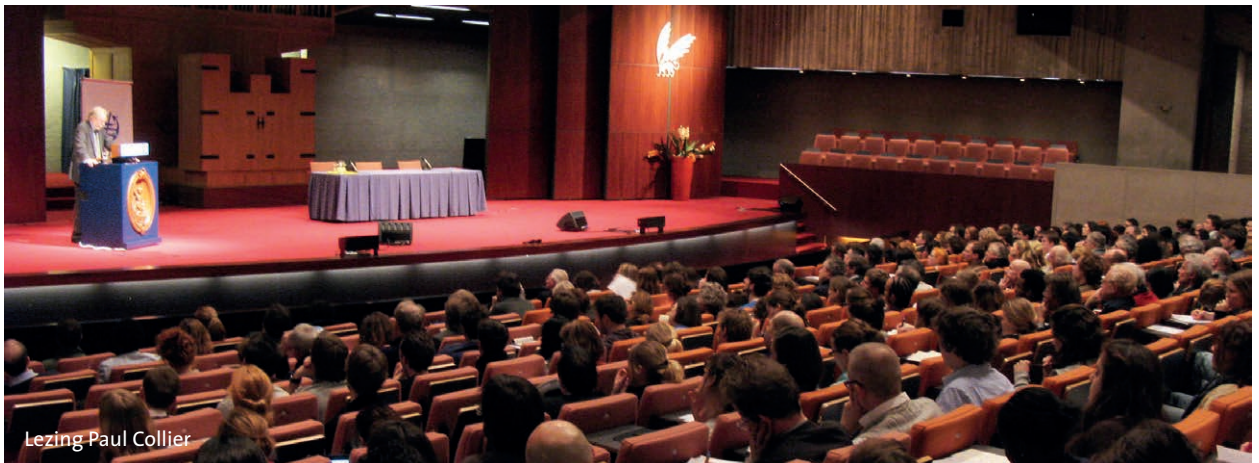
Lezing Paul Collier

Per lezing zaten zo'n 70-95 mensen in de zaal met uitzondering van Paul Collier die 450 mensen naar de VU trok. Het publiek bestond voornamelijk uit academici, maatschappelijk middenveld, en beleidsmakers. Vergeleken met voorgaande jaren, is vooral het aantal studenten die de SID lezingen bezoekt toegenomen. Alle verslagen van de lezingen zijn te vinden op de website van SID. In 2012 verschijnt een bundel bij KIT Publishers waarin alle lezingen zijn terug te lezen.