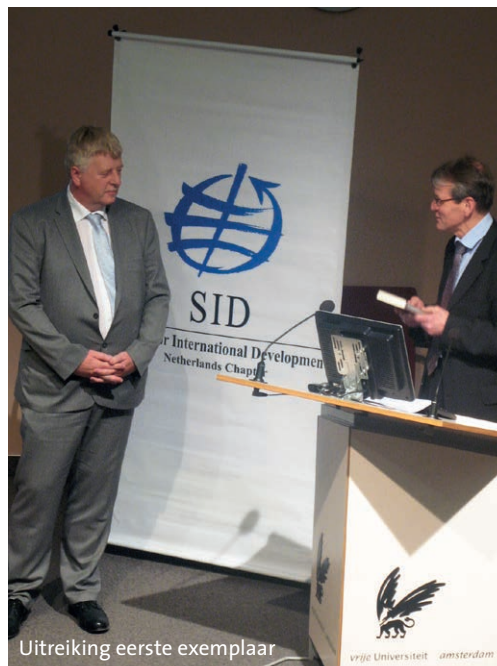
Uitreiking eerste exemplaar