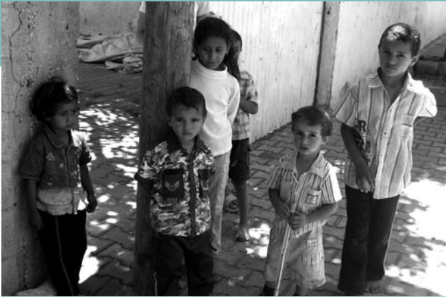
In Gaza lijdt meer dan 13% van de kinderen jonger dan 5 jaar aan groeistoornissen

We hebben ook campagne gevoerd om de negatieve houding tegenover de ongeveer 40.000 zwaar gehandicapte mensen in Gaza te veranderen. Tijdens de recente oorlog raakten zo'n 5.000 mensen gewond, en de meerderheid raakte blijvend gehandicapt. Israël gebruikte nieuwe wapens die het aantal slachtoffers maximaliseerden. Soms raakten mensen slechts licht gewond door granaatscherven, maar stierven ze een paar dagen later toch nog. Met die wapens experimenteerden ze op ons, net als met fosforwapens, misschien om die daarna in het buitenland te kunnen verkopen. Niemand weet wat de gevolgen daarvan op de lange termijn zullen zijn.