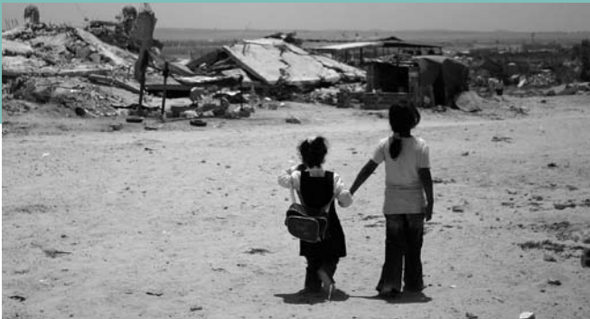
Twee kinderen dwalen rond in een verwoeste buurt van het kamp van Jabalia