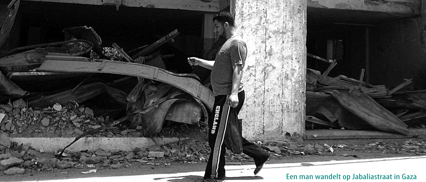
Een man wandelt op Jabaliastraat in Gaza

een slagveld. De meest dramatische, grootse en beladen verhalen kwamen altijd van daar.