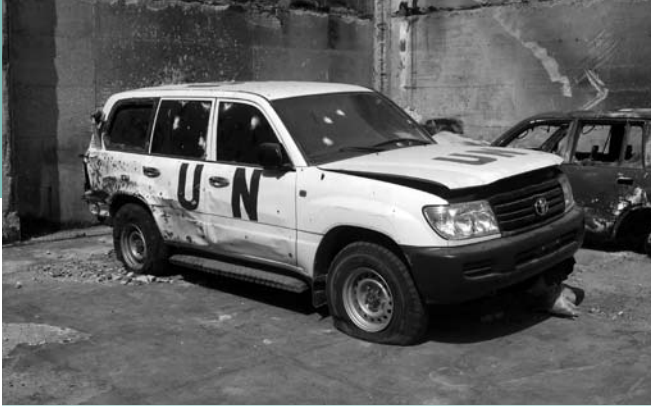
Een VN-voertuig beschadigd bij een Israëlische aanval op het UNWRA-hoofdkwartier in Gaza-stad

Gaza. Miljarden dollars werden beloofd. Dit overtrof alle verwachtingen en deed de hoop weer opleven. Jammer genoeg kon er niets in de praktijk worden omgezet, omdat de grens is afgesloten. We kunnen het proces van heropbouw niet starten.