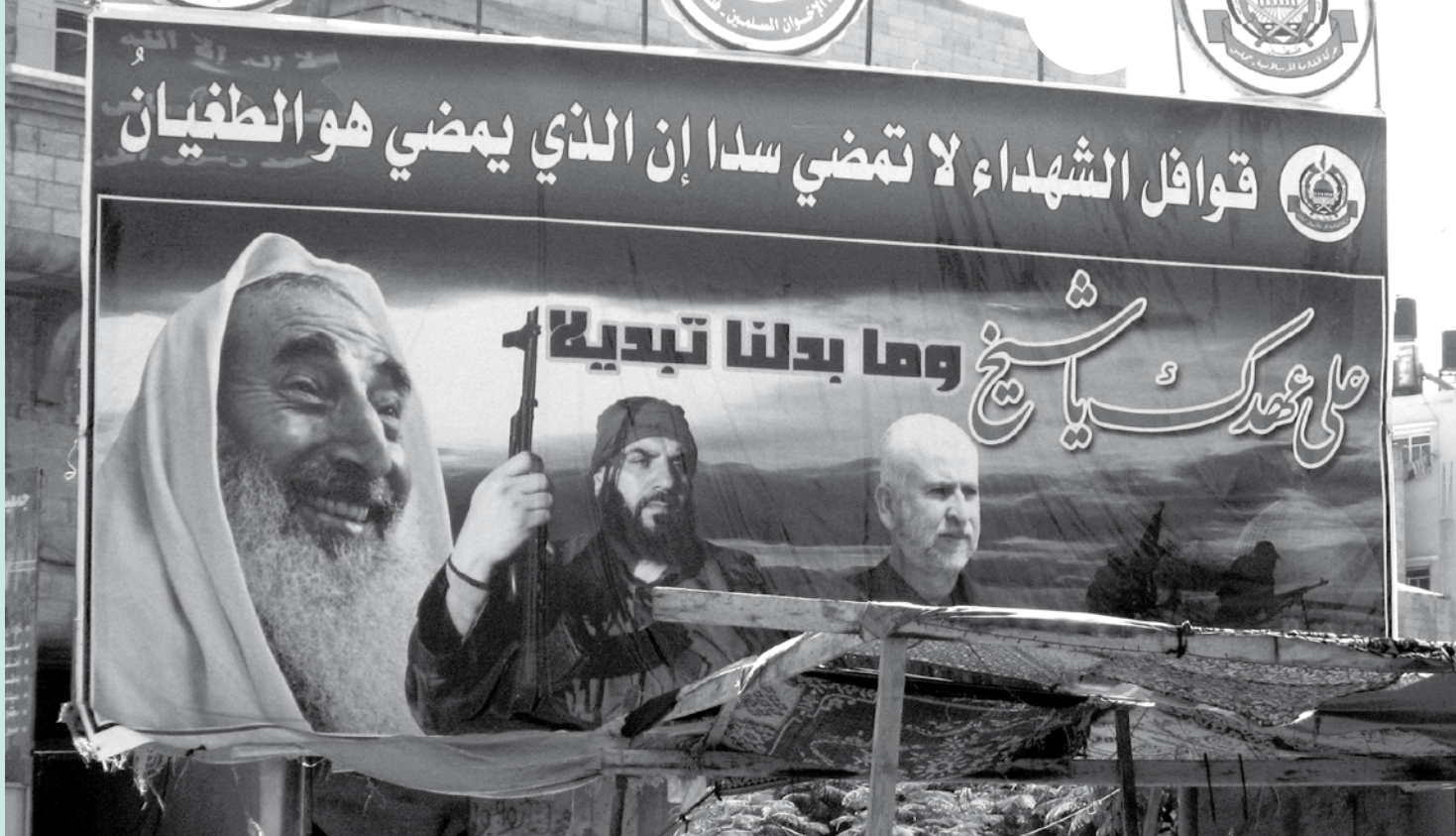
Een spandoek op straat met een afbeelding van Ahmad Yassin, de medestichter en spirituele leider van Hamas