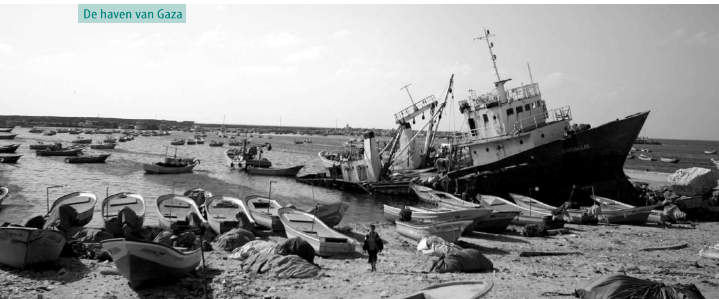
De haven van Gaza