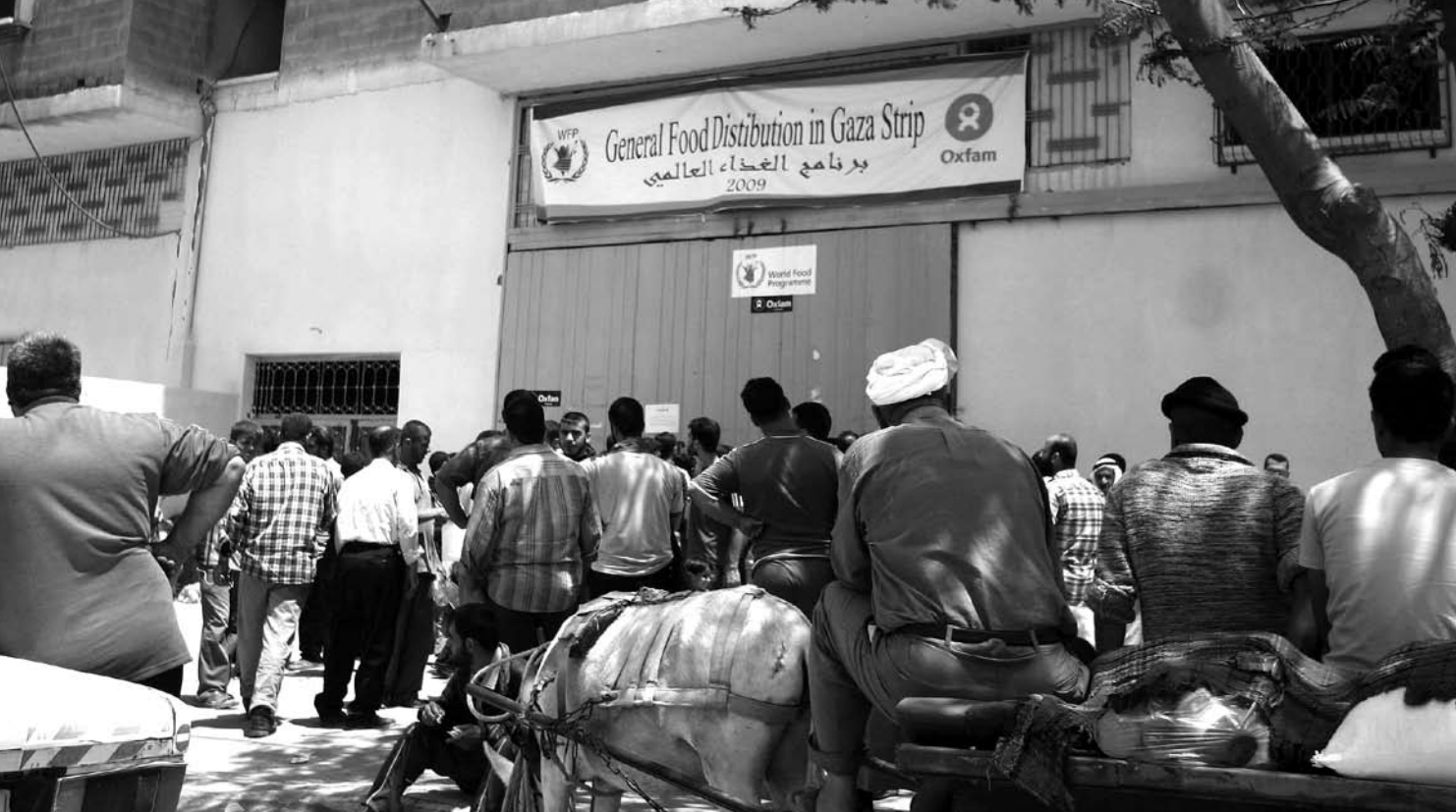
Palestijnen in de rij voor voedselhulp in Gaza-stad

Maar de Israëlsche bezetting is voor een groot deel verantwoordelijk voor onze situatie. Boeren waren hier al heel arm, maar sinds de laatste oorlog heeft minstens 15% van hen geen toegang meer tot hun land. Ze zijn werkloos en afhankelijk van internationale voedselhulp. Afhankelijkheid is een groot probleem hier en we hebben gemerkt dat het produceren van je eigen voedsel een gevoel van macht geeft. Het verandert je omgeving en geeft je er controle over. Je wordt productief en dat betekent veel voor een mens.