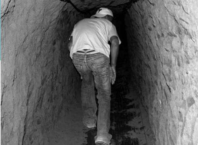
Tunnels in Rafah – een levensbelangrijke maar gevaarlijke en onhoudbare levenslijn voor Gaza.

konden drijven. In september 2007 verklaarde het Israëlische kabinet Gaza tot vijandige entiteit, waardoor de Israëlische banken geen zaken meer deden met de onze. Geldtransacties tussen Israël en Gaza vielen stil, en er brak een crisis uit. Er kwamen minder shekels Gaza binnen, maar we hadden wel nog 400 miljoen shekel per maand nodig om 70.000 ambtenaren te betalen en verbintenissen met de privésector en UNRWA-medewerkers te kunnen nakomen.