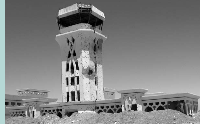
Internationale luchthaven van Gaza — systematisch vernietigd door het Israëlische leger tijdens de Tweede Intifada