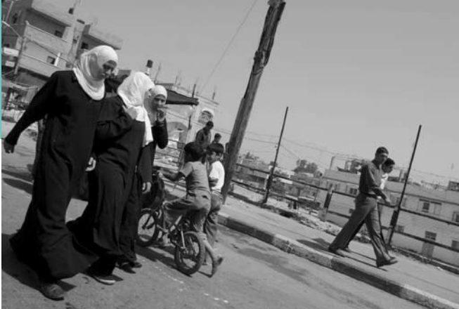
Vrouwen wandelen op straat in Jabalia in Noord-Gaza

familie. Mijn ooms moffelden ons al snel helemaal weg in de jalbab (een lang, loszittend kledingstuk dat lijkt op een lange jas).