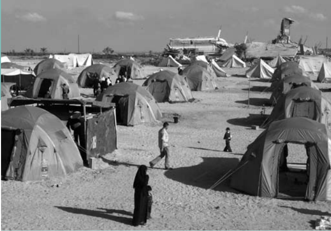
Opnieuw dakloos – een tentenkamp in Noord-Gaza, opgezet na de oorlog van '08-'09

die getraumatiseerde kinderen helpt om zichzelf uit te drukken door middel van theater, kunst en toneel.