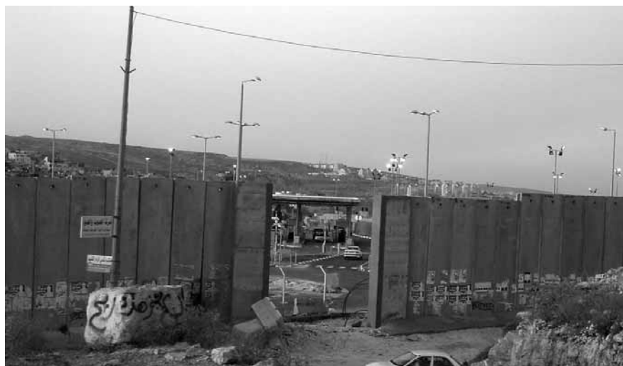
Sta in de weg voor definitieve vredesregeling