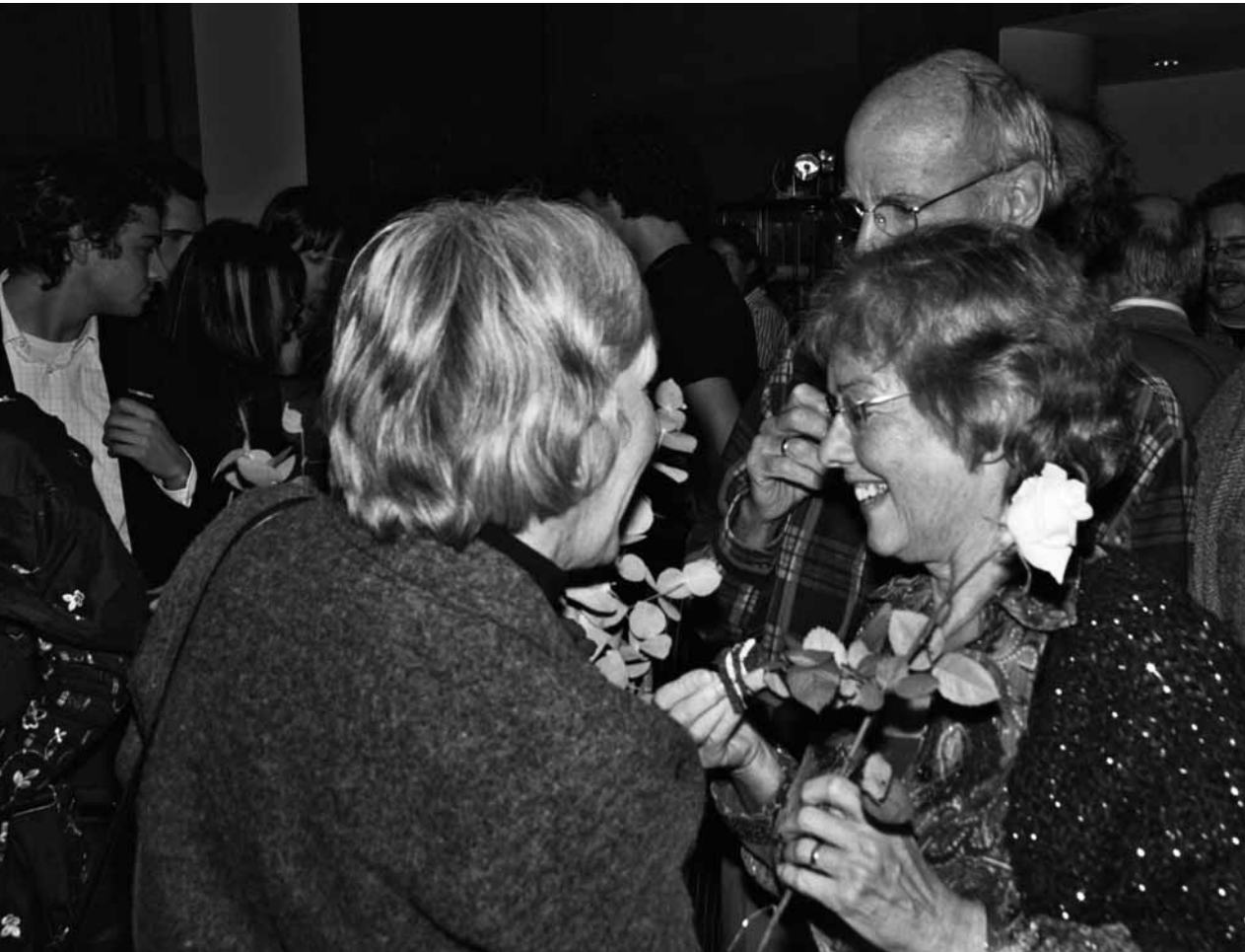
Feest van herkenning

Op tal van bijeenkomsten wordt het thema 'De ander dat ben jij' verder uitgediept. Bij vier manifestaties treedt het IKV op als organisator, maar bij vele tientallen andere fungeert het ondersteunende campagnemateriaal van de Vredesweek als voornaamste stimulans.