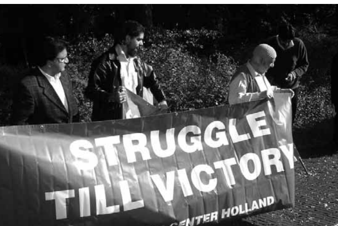
Steun voor Kasjmir vanuit Nederland