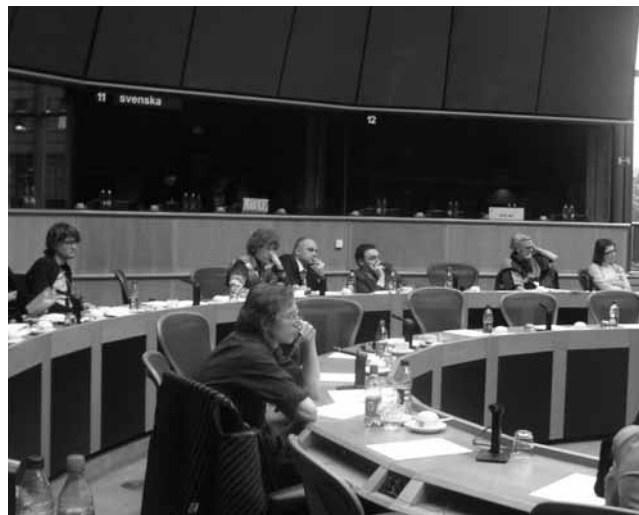
Aandacht voor Balkan op de politieke agenda houden

In 2006 krijgt Servië een nieuwe grondwet waarin expliciet staat dat Kosovo deel van de Servische republiek blijft. Dat bemoeilijkt het werk van VN-onderhandelaar Martti Ahtisaari die bemiddelt tussen de politici van de Albanese meerderheid in Kosovo en de Servische regering in Belgrado. IKV partners zijn het ook niet allemaal eens met elkaar. Toch blijft het IKV in Servië Montenegro en Kosovo aan multi-etnische burgerparticipatie en harmonisatie van inter-etnische relaties werken. In