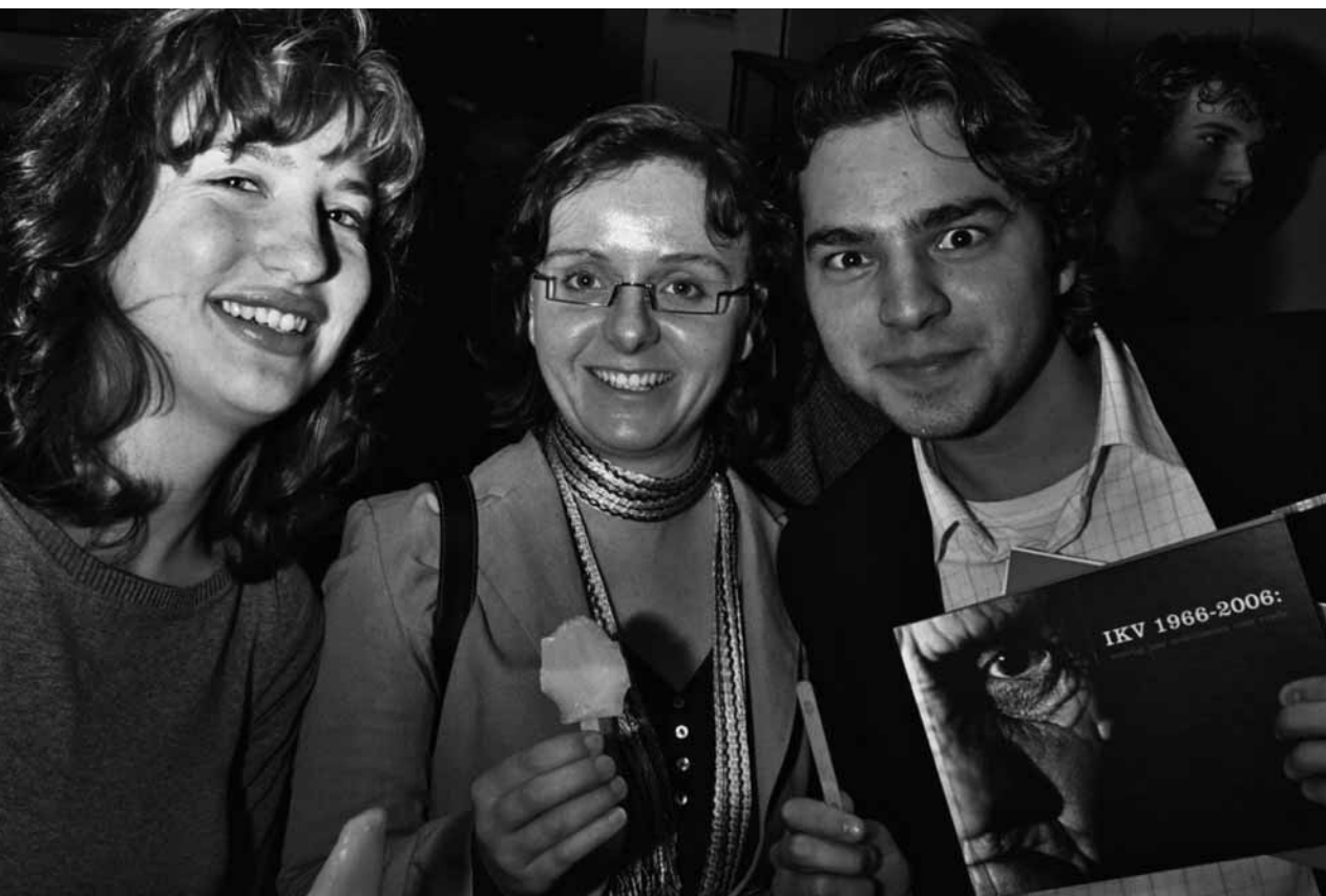
Jong en oud op verjaardagsfeest IKV

en Nagorno Karabach. Ten behoeve van de actie worden er tijdens de Vredesweek 2006 radio- en tv-spots uitgezonden. Vier vredesactivisten zijn aanwezig bij de start van de campagne. Ze geven lezingen aan allerlei lokale kerkelijke en vredesgroepen in Nederland. Een foto-expositie ondersteunt de lezingen van de vredesactivisten. De actie levert 85.000 euro op.