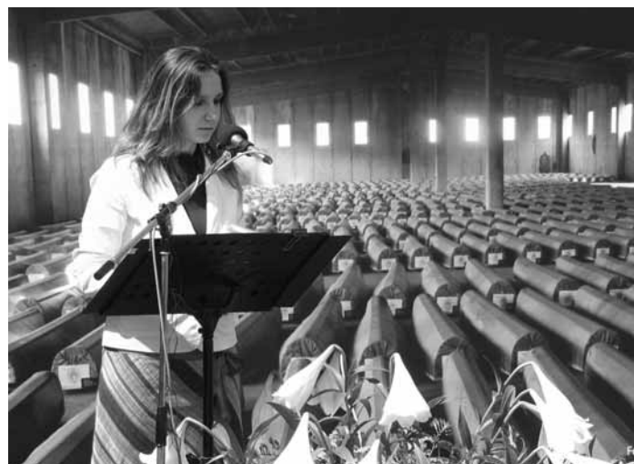
Nooit meer Srebrenica