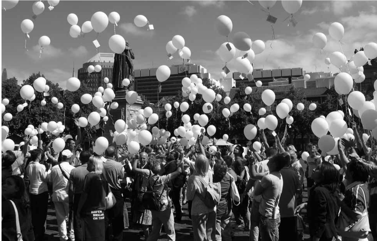
Meerdere grote publieksmanifestaties in 2006