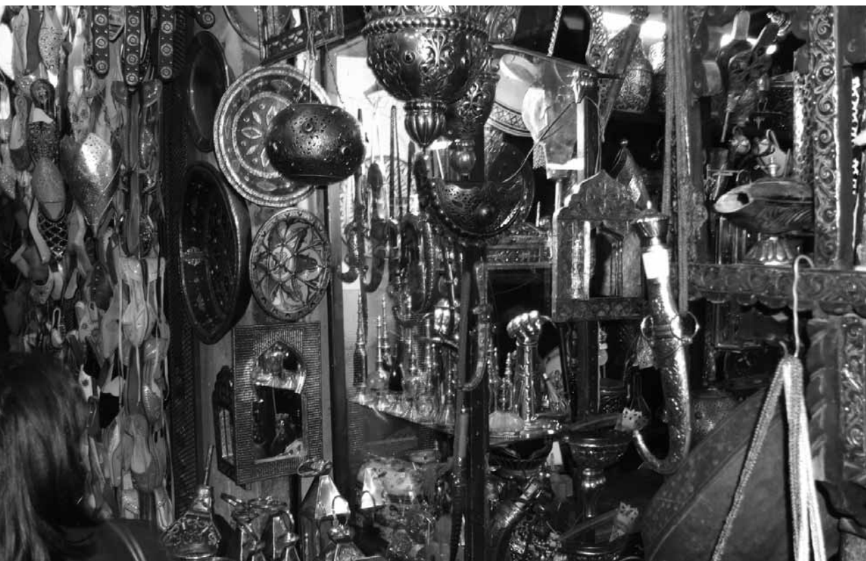
Marokkaanse cultuur zichtbaar in Parijs