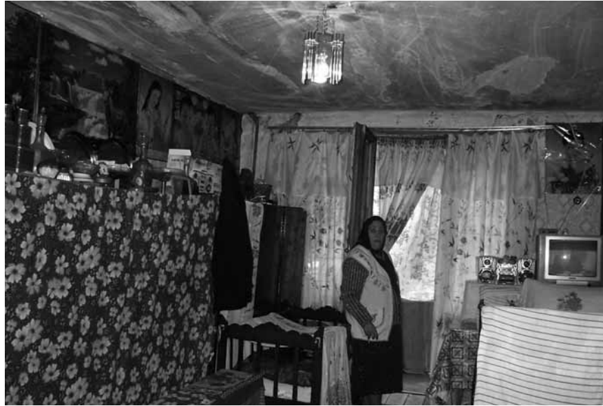
Dagelijks leven is overleven