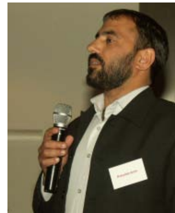
Gastspreker Dr. Amin uit Afghanistan

Doel van de conferentie was het in kaart brengen hoe religieuze actoren kunnen bijdragen aan vredesopbouw en ontwikkeling in hun land en hoe Nederlandse professionals op het gebied van ontwikkeling en vredesopbouw kunnen omgaan met het constructieve en destructieve potentieel van lokale religieuze actoren. Een aantal bevindingen uit de conferentie sluiten aan bij de conclusies van de rondetafelgesprekken. Hieronder volgen daarom de belangrijkste observaties van de deelnemers aan de conferentie, die de conclusies uit de rondetafelgesprekken aanvullen. 6